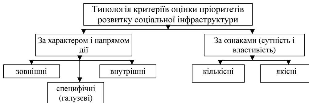
Рис. 1. Узагальнена типологія критеріїв виокремлення пріоритетів соціальної інфраструктури

Так, критеріальна характеристика розвитку соціальної інфраструктури може бути представлена такою типологією індикаторів: група зовнішніх, внутрішніх і специфічних критеріїв. До групи зовнішніх критеріїв-індикаторів можна віднести: особливості і специфіку процесів світової глобалізації; конкурентні позиції країни на світовому ринку; світові тенденції соціально-економічного розвитку; тенденції та рівень міжнародних зв'язків; участь у світових економічних організаціях; сформованість міжнародного співробітництва; рівень розвитку транскордонного співробітництва; характер процесів регіоналізації. До типу внутрішніх критеріїв, які формують соціально-економічний розвиток, зокрема, соціальної інфраструктури, належать: загальна економічна ситуація; рівень економічного розвитку; загальна політична ситуація в країні; тенденції соціального розвитку і фінансово-кредитна та податкова політика; ступінь сформованості ринку; демографічні тенденції; рівень безробіття; особливості розподілу та розміщення населення; активність інвестиційно-інноваційної діяльності; зміни законодавчо-нормативного характеру; зрушення у фундаментальній науці, технологіях, техніці; зміни режимів господарювання.