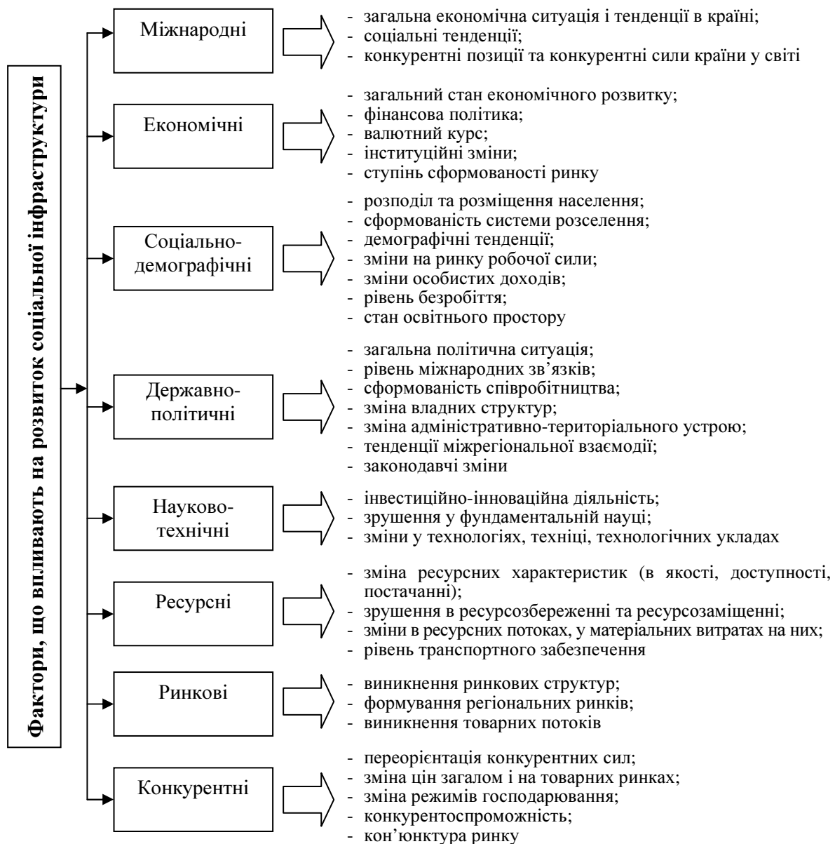
Рис. 3. Фактори, що характеризують можливості та загрози з боку зовнішнього та внутрішнього середовища у виборі та оцінці критеріїв пріоритетного розвитку соціальної інфраструктури

Конкретизуючи факторіальну класифікацію стосовно соціальної інфраструктури в напрямі обґрунтування критеріїв оцінки вибору пріоритетів з функціональною орієнтацією можна систему факторів представити такими групами: міжнародні, економічні, соціально-демографічні, політичні, науково-технічні, ресурсні, ринкові, кон'юнктурні (рис. 3).