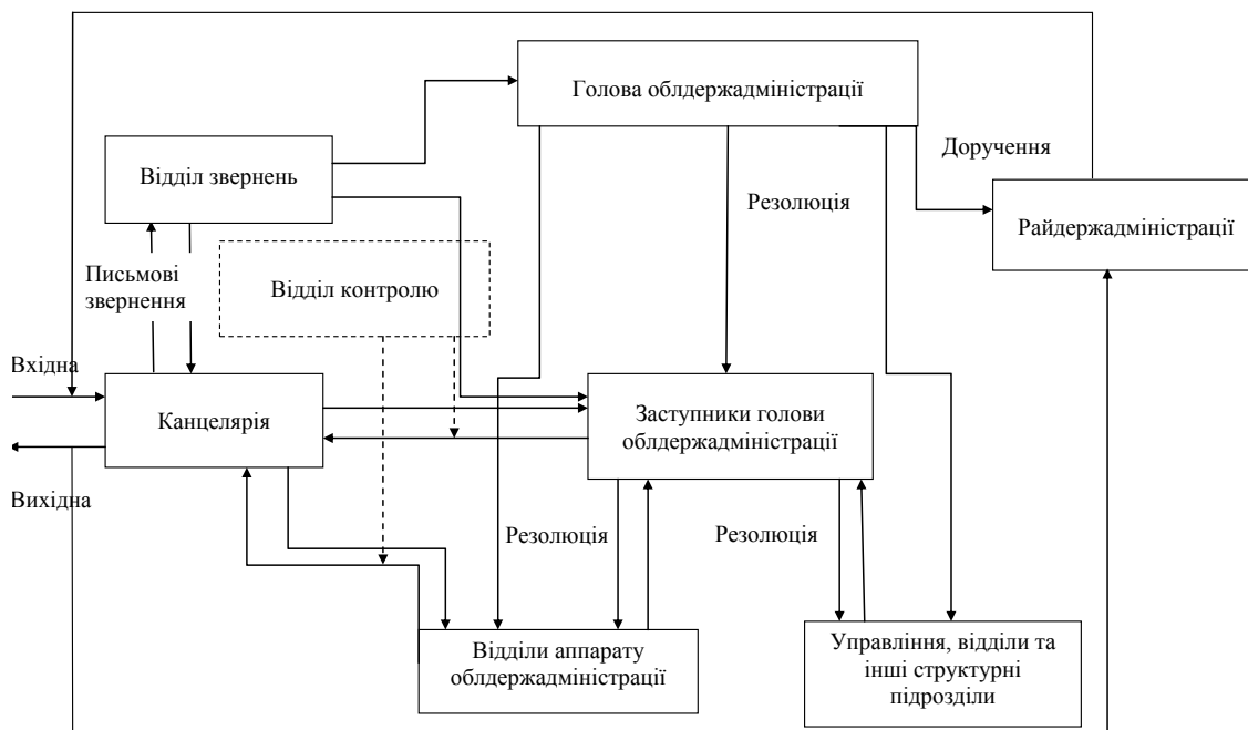
Рис. 1. Схема проходження документів в апараті облдержадміністрації

Зовнішня інформація надходить до канцелярії апарату обласної державної адміністрації, після реєстрації спрямовується до заступника голови, а письмові звернення спрямовуються до відділу звернень, а далі до голови, або його заступника. Голова після розгляду і накладання певних резолюцій спрямовує інформацію заступнику, у відділи апарату облдержадміністрації, управління, відділи та інші структурні підрозділи, а також надає доручення до райдержадміністрацій. Заступник голови після розгляду спрямовує кореспонденцію у функціональні підрозділи на подальше опрацювання. Після опрацювання й отримання необхідних підписів керівництва обласної державної адміністрації інформація через канцелярію спрямовується до відповідних адресатів.