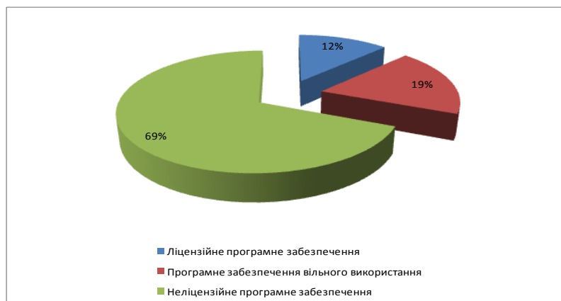
Рис. 3. Використання ліцензійного програмного забезпечення в апараті облдержадміністрації та райдержадміністраціях

Дослідження свідчать, що майже 70 % програмного забезпечення, яке використовується в апараті обласної державної адміністрації та районних державних адміністраціях є неліцензійним. Деякі прикладні програми, які необхідні для виконання спеціальних завдань, насамперед антивірусні, на жаль, неліцензійні. Оскільки немає фінансової можливості закупити необхідну кількість ліцензійних копій відповідного програмного забезпечення, а також оплачувати оновлення версій.