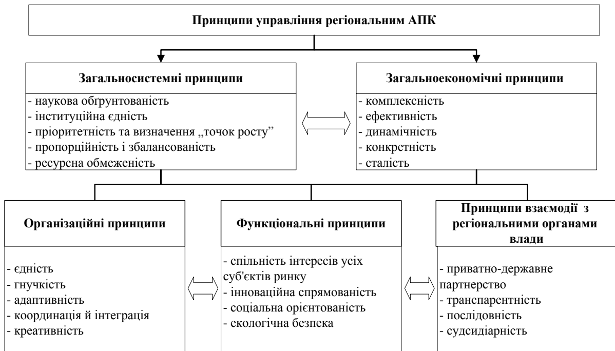
Рис. 2. Принципи управління функціонально-територіальної організації регіонального АПК

Особливу увагу при системній організації регіонального АПК необхідно приділяти її специфічним принципам, властивим тій чи іншій формі, виду чи галузі агропромислового виробництва. Загальновідомо, що одним із необхідних факторів розвитку суб'єктів господарювання АПК є державна аграрна політика. Таким чином, у складі принципів функціонально-територіальної організації агропромислового виробництва регіону повинні бути представлені і принципи підтримки його з боку регіональних органів влади (рис. 2).