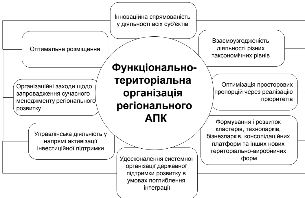
Рис. 1. Органіграма основних компонентів системної організації функціонально-територіального регіонального АПК

Особливу увагу при системній організації регіонального АПК необхідно приділяти її специфічним принципам, властивим тій чи іншій формі, виду чи галузі агропромислового виробництва. Загальновідомо, що одним із необхідних факторів розвитку суб'єктів господарювання АПК є державна аграрна політика. Таким чином, у складі принципів функціонально-територіальної організації агропромислового виробництва регіону повинні бути представлені і принципи підтримки його з боку регіональних органів влади (рис. 2).