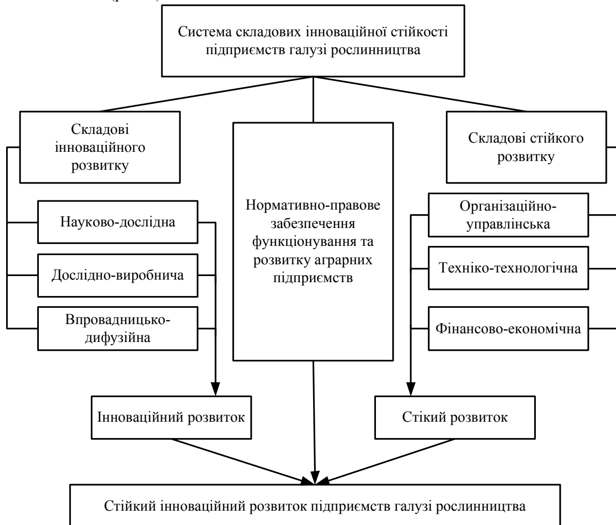
Рис. 1. Складові стійкого інноваційного розвитку підприємств галузі рослинництва

Реалізація інноваційної моделі розвитку аграрного виробництва можлива за умов інноваційної стійкості підприємств галузі рослинництва, яка ґрунтується на відповідних складових (рис. 1).