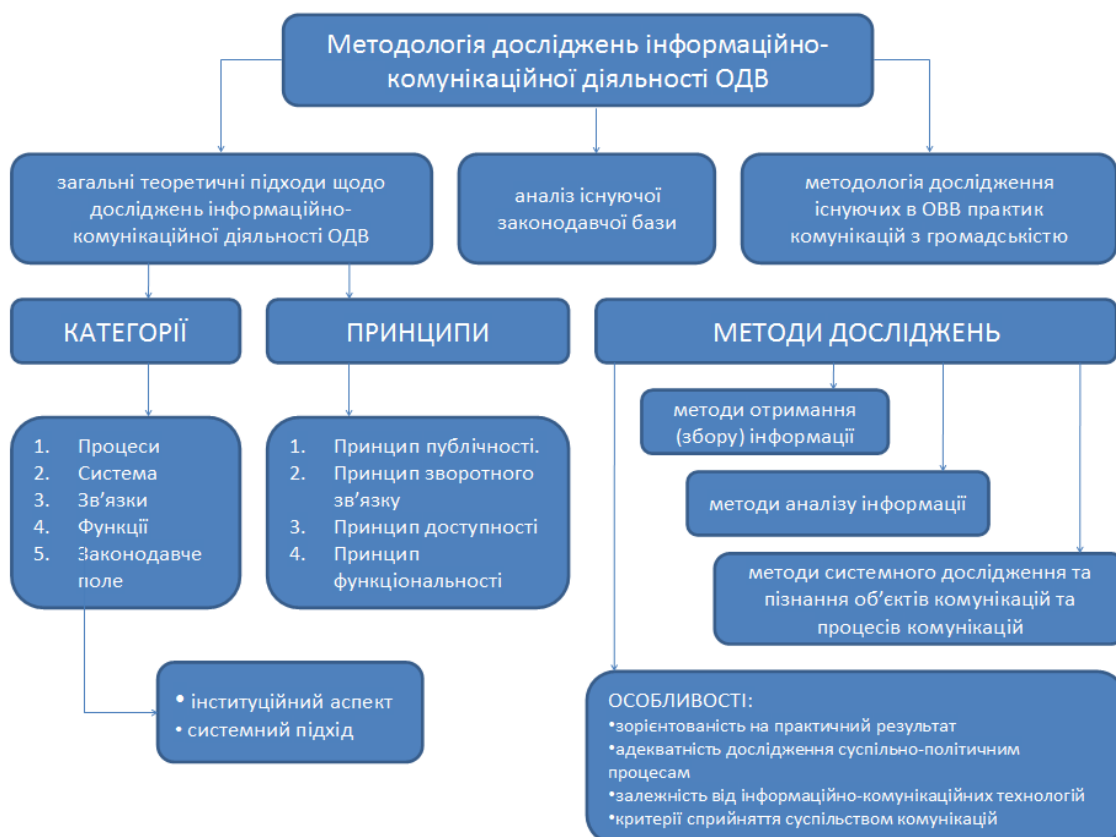
Рис. 2 Методологія наукових досліджень інформаційно-комунікаційної діяльності ОДВ

Загальна система методології наукових досліджень інформаційно-комунікаційної діяльності ОДВ представлена на рис.2.