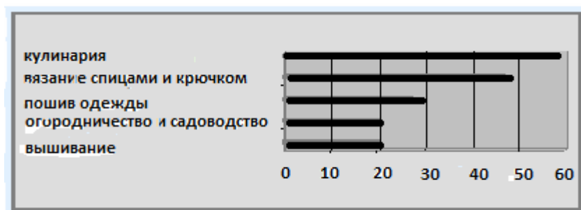
Рис 3. Результати анкетного опитування людей похилого віку в Миколаївському міському територіальному центрі соціального обслуговування про вибір напрямку факультативних занять в "Університеті третього віку"

Після оброблення анкет, ми дійшли висновку, що на базі територіальних центрів ми не зможемо організувати для людей похилого віку отримання повноцінної соціально-педагогічної послуги «УТВ». Хоча територіальні центри соціального обслуговування населення покликані працювати з людьми старшого покоління і на них покладені основні обов'язки організації соціально-педагогічної послуги «УТВ» – ці структури самостійно не в змозі на належному рівні виконати поставлене завдання. Адже ці центри, у своїй більшості, не мають спортивних залів, комп'ютерних класів, аудиторій та кваліфікованих викладачів, які могли б ефективно проводити заняття з людьми старшого покоління, що істотно обмежувало їх можливості. Суттєвим, на нашу думку, є і той факт, що в територіальних центрах безкоштовно послугу «УТВ» мають право отримувати лише самотні пенсіонери, і ті, у яких немає дітей, або ті, у яких середньомісячний дохід нижче прожиткового рівня, що істотно обмежувало кількість людей старшого покоління, які бажають отримувати послугу «УТВ».