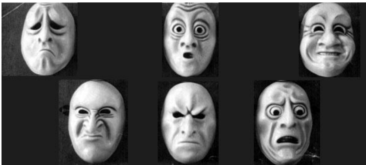
Рис. 3.4 - В (1 - 6)