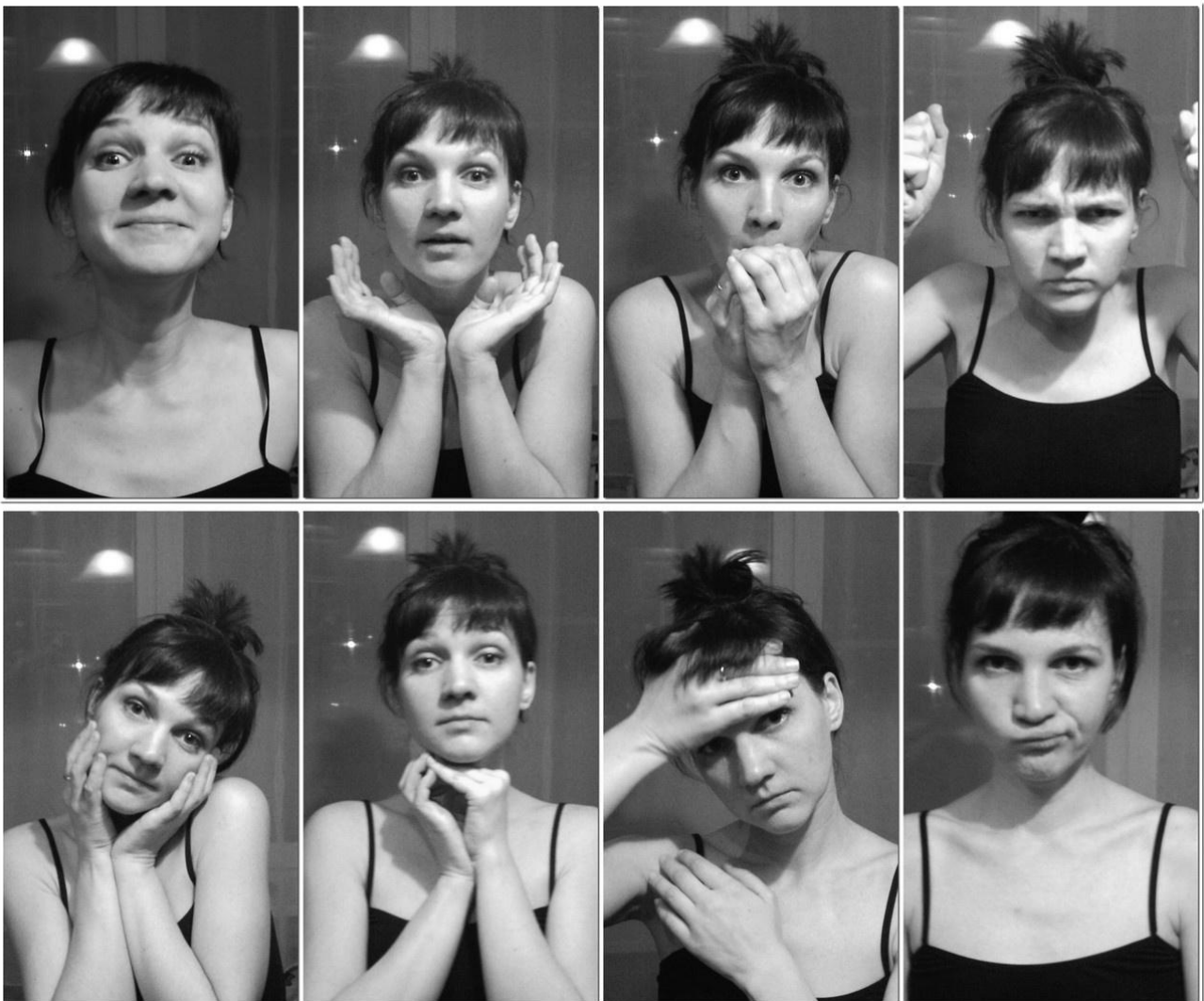
Рис. 3.3 - Б (1 - 4)