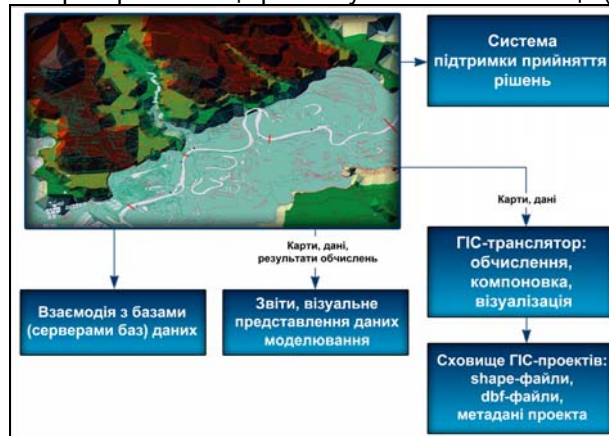
Рис. 2. Приклад опрацювання інформації про територіальні утворення за допомогою ГІС

ГІС здатні дати відповіді на запити і функції аналізу просторових даних, наприклад, у вирішенні таких завдань, як подання різноманітної інформації за запитами органів планування, вирішенні земельних конфліктів, виборі оптимальних за певними критеріями місць розташування об'єктів тощо (рис. 2).