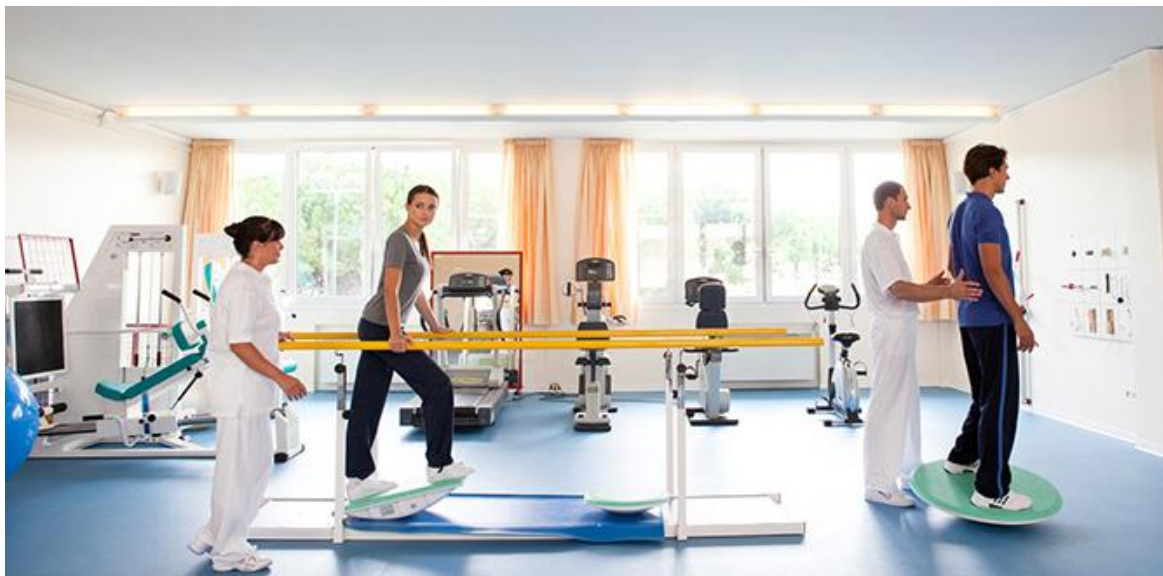
Рис. 3.3. Спортивна реабілітація