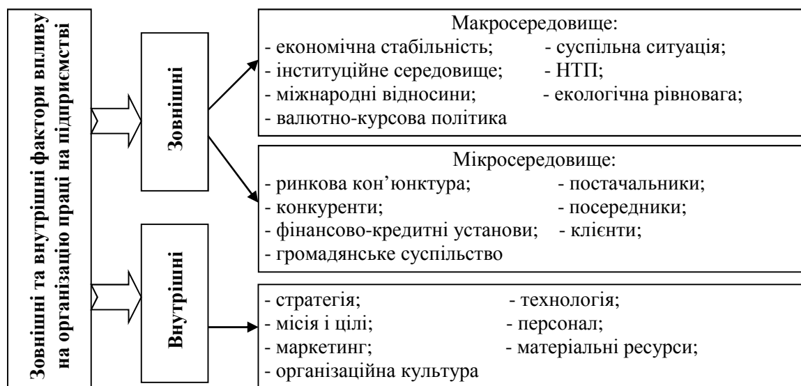
Рис. 1. Зовнішні та внутрішні фактори впливу на організацію праці на підприємстві

Зовнішні фактори впливу перебувають поза підприємством та існують незалежно від нього, але впливають або можуть у будь-який момент вплинути на його функціонування. Загальною рисою факторів зовнішнього середовища є не контрольованість їх з боку підприємства. Залежно від характеру впливу зовнішні фактори впливу на організацію праці на підприємстві можна поділити на дві групи: