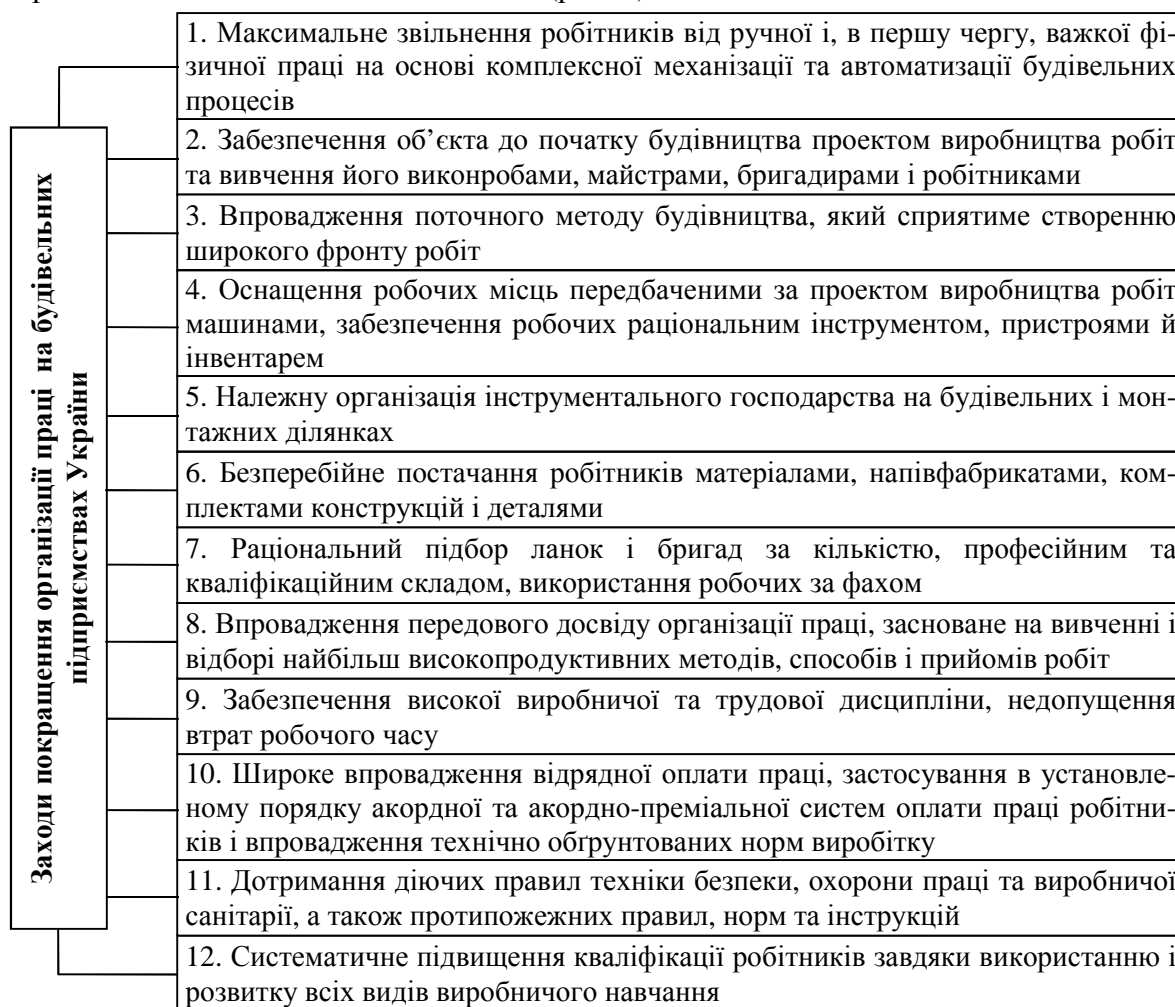
Рис. 4. Заходи покращення організації праці на будівельних підприємствах України

З метою поліпшення організації праці на вже існуючих будівельних підприємствах України доцільно здійснити такі заходи (рис. 4):