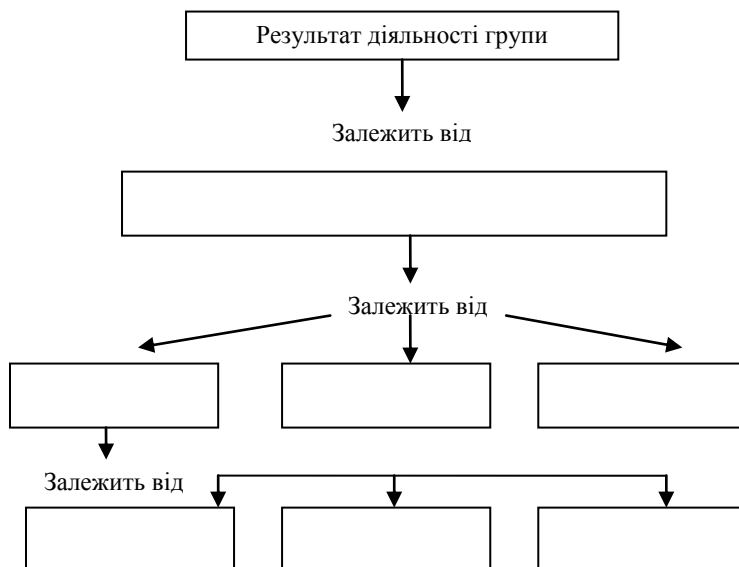
Рис. 2.1. Ефективність комунікацій в організації

Вихідні дані. На рисунку 2.1 наведено ієрархію комунікацій між членами колективу всередині компанії. У таблиці 2.3 наведені характеристики, що визначають ефективність комунікацій між членами колективу організації.