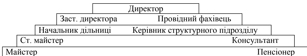
Рисунок 2.3 - Типова модель «Сходи»

Кар'єра «Трамплін» широко поширена серед керівників і фахівців. Кар'єра «Трамплін» найбільш характерна для керівників періоду застою в економіці, коли багато посад в центральних органах і на підприємствах займалися одними людьми по 20-25 років. З іншого боку, дана модель є типовою для фахівців і службовців, які не ставлять перед собою цілей просування по службі. В силу ряду причин: особистих інтересів, невисокою завантаження, гарного трудового колективу, набутої кваліфікації працівників цілком влаштовує займана посада, і вони готові залишатися на цій посаді до відходу на пенсію. Таким чином, кар'єра "Трамплін" може бути цілком прийнятною в умовах ринкової економіки для великої групи фахівців і службовців.