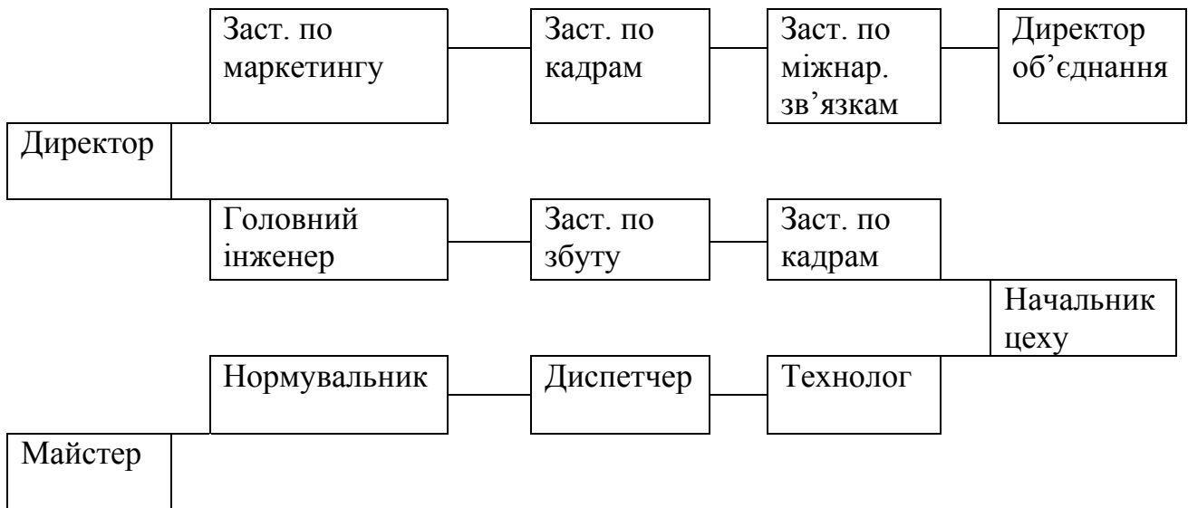
Рисунок 2.4 - Типова модель «Змія»

Модель кар'єри «Змія» придатна для керівника та спеціаліста. Вона передбачає горизонтальне переміщення працівника з однієї посади на іншу шляхом призначення із заняттям кожної нетривалий час (1-2 р). Наприклад, майстер після навчання та школі менеджерів працює послідовно диспетчером, технологом та економістом, а потім призначається на посаду начальника цеху. Це дає можливість лінійному керівнику більш глибоко вивчити конкретні функції управління, які йому знадобляться на вищостоящій посаді. Перш ніж стати директором підприємства, керівник протягом 6-9 років працює заступником директора по кадрам, збуту та маркетингу і всебічно вивчає важливі ділянки діяльності.