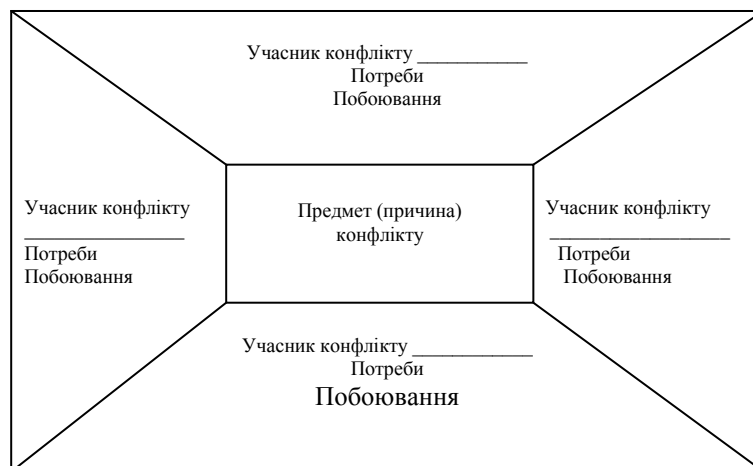
Рисунок 2.6 – Карта конфлікту

Австралійські конфліктологи Х. Корнелиус и Ш. Фейр запропонували ефективний методичний прийом аналізу конфліктної ситуації – складання карти конфлікту (рис. 2.6).