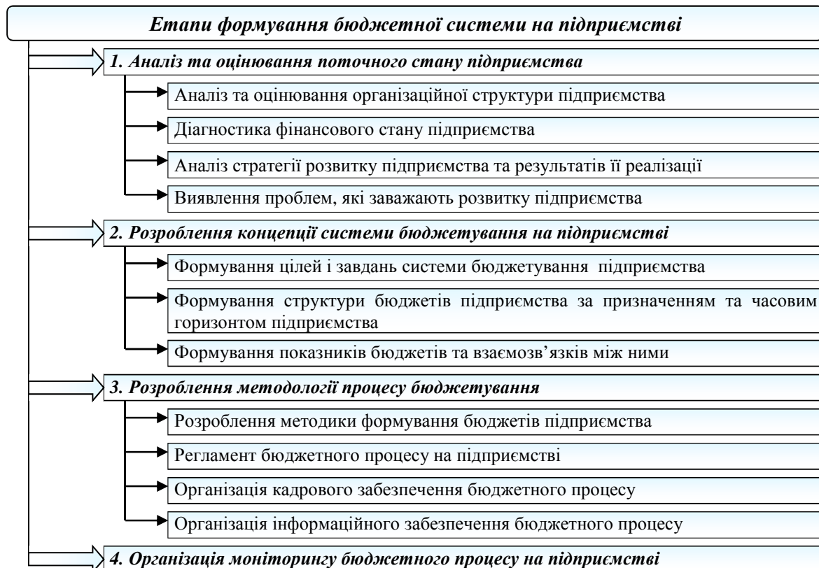
Рис. 2. Етапи формування бюджетної системи на підприємстві

На наш погляд, система бюджетування являє собою сукупність бюджетів підприємства та методів їх розроблення та реалізації. Формування ефективної системи бюджетування на підприємстві потребує виконання певних послідовних етапів (рис. 2).