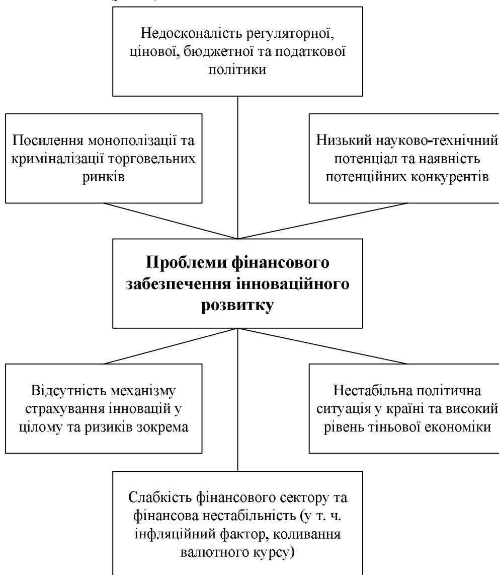
Рис. 2. Проблеми фінансового забезпечення інноваційного розвитку сільськогосподарського машинобудування

Серед основних проблем, що стримують фінансування наукової та науково-технічної діяльності вітчизняних підприємств сільськогосподарського машинобудування, можна виділити такі (рис. 2):