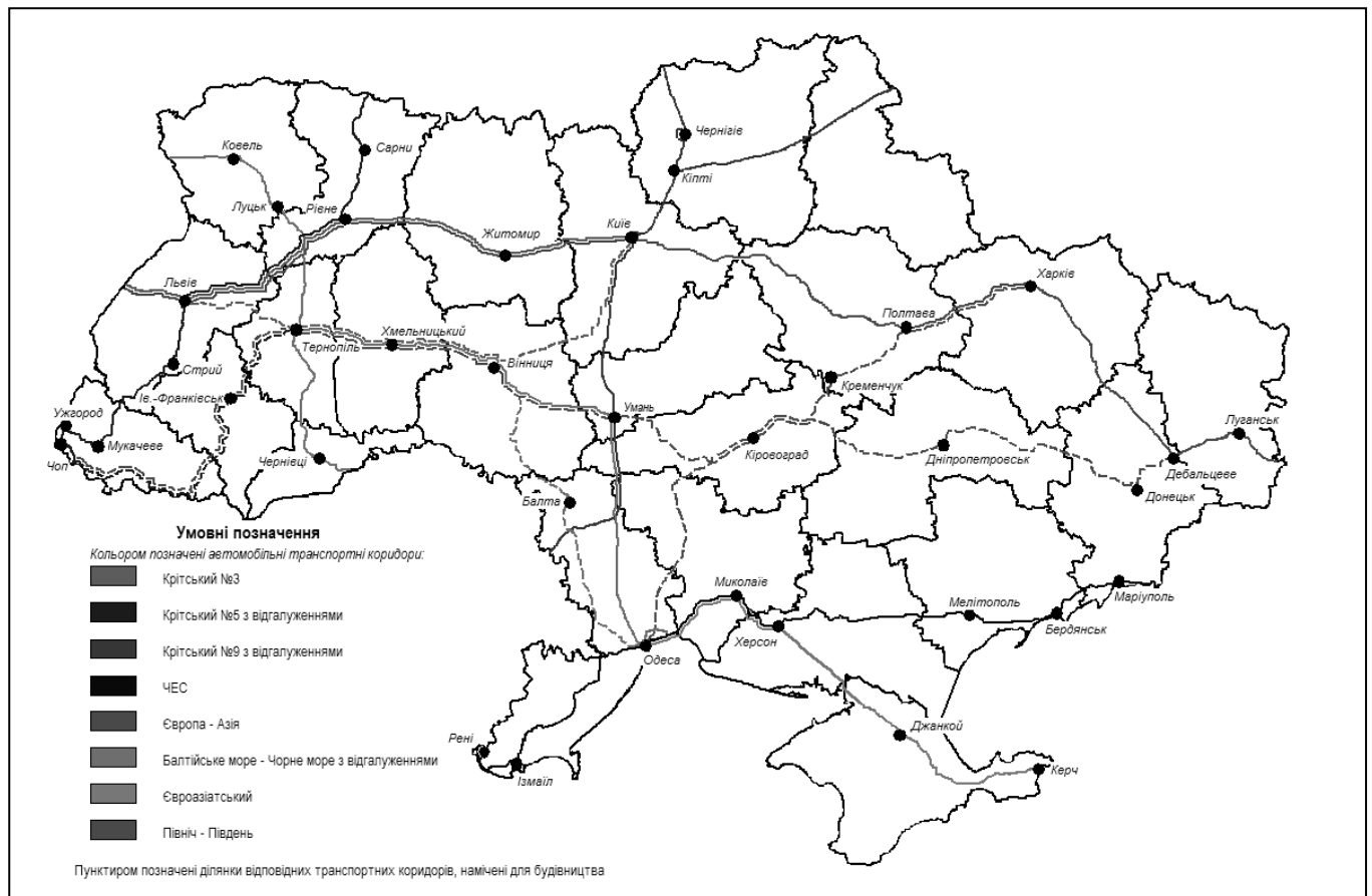
Рис. 1. Автомобільні транспортні коридори, що проходять територією України

Під час проектування дороги, в залежності від найбільшої перспективної годинної інтенсивності дорожнього руху визначається її категорія. Дороги I і II категорій передбачають наявність чотирьох і більше смуг руху та пересування на високій швидкості. Їх технічні параметри найбільше відповідають сучасним європейським і світовим вимогам до автомагістралей і становлять всього 15,6 тис. км, тобто 9,2% загальної довжини (табл. 3). Найбільша частка таких доріг в Київській - 16,7%, Донецькій - 15,2%, Запорізькій - 13,7% і Луганській - 11,3% областях, а також в Автономній Республіці Крим - 14,6%. Гірше за всіх забезпечені сучасними дорогами I і II категорій Кіровоградська область - 4,0%, Чернігівська - 4,1%, Вінницька - 4,9%, Сумська - 5,0% і Полтавська - 5,4%.