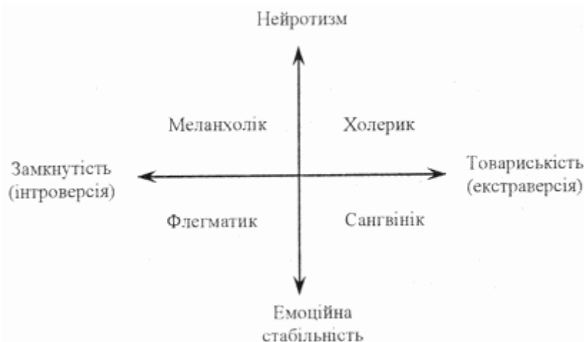
Рисунок 7.2 – Особливості поєднання типів людей з їхнім темпераментом (за Х. Айзенком)

Відкладіть на схемі (рисунок 7.2) отримані результати за шкалою «інтроверсія – інтроверсія» і за шкалою «нейротизм» (емоційна стійкість – нестабільність). Поєднання кількісних показників по двох шкалах вкаже на тип вашого темпераменту.