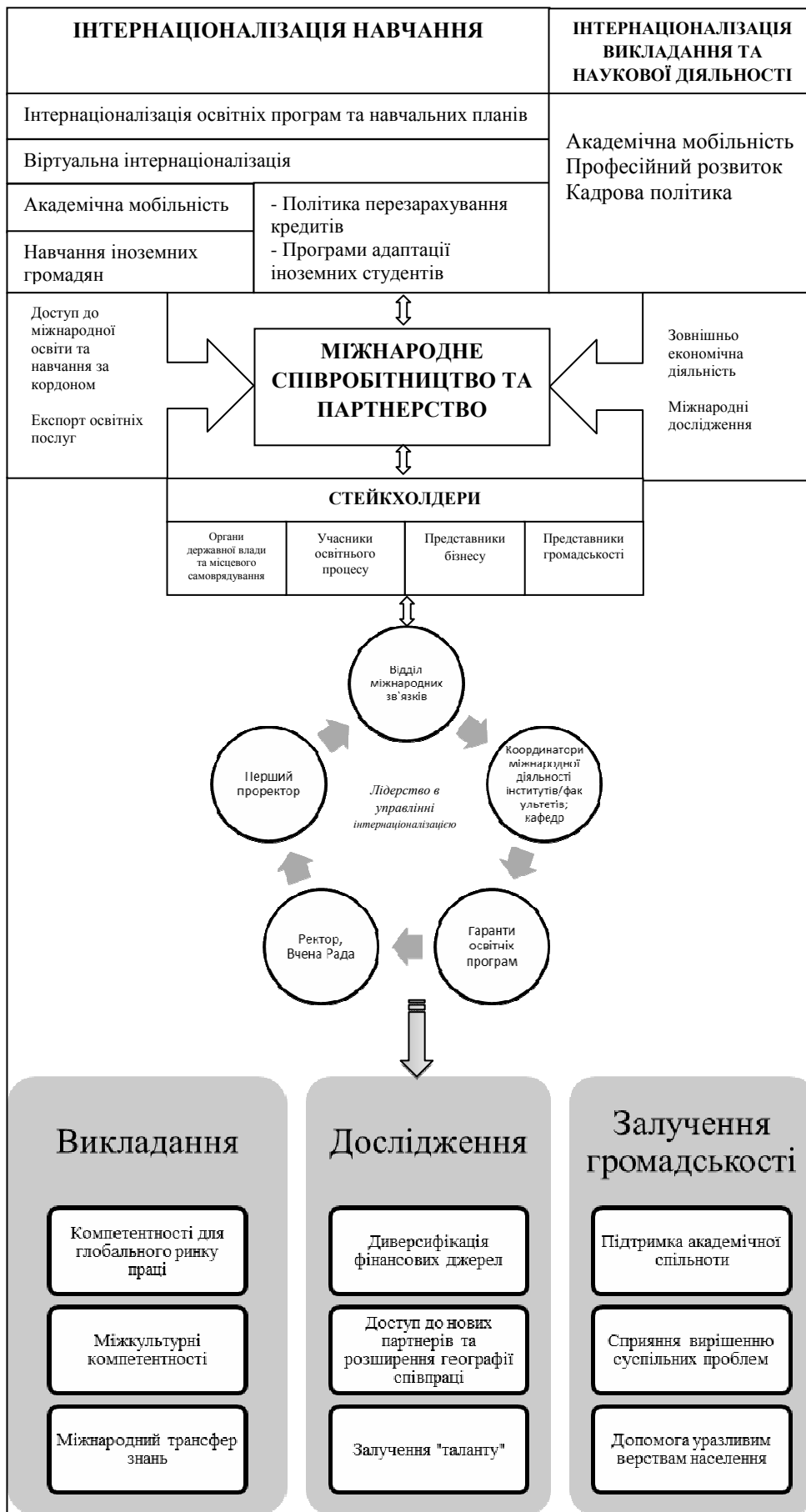
Рис. 1. Інтегрована модель інтернаціоналізації закладу вищої освіти