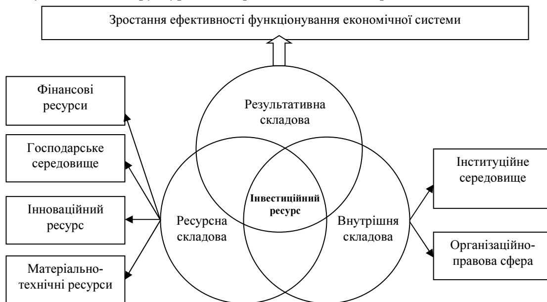
Рис. 1. Структура інвестиційного ресурсу

Як видно з табл. 1, більшість авторів трактує поняття інвестиційного ресурсу з позиції певної сукупності ресурсів, активів або засобів, що існують у розпорядженні підприємства. У контексті національної економіки цей термін майже не використовується, а тому доцільним є запропонувати авторське тлумачення інвестиційного ресурсу як сукупності фінансових, матеріально-технічних, інтелектуальних та інформаційно-правових елементів, які має у своєму розпорядженні національна економіка і які використовуються для забезпечення інвестиційного розвитку країни. Являючи собою складну динамічну систему, інвестиційний ресурс містить комплекс взаємодіючих елементів, науковий відбір і комбінація яких забезпечують появу нових і вдосконалення наявних елементів. Це стало основою виокремлення у структурі інвестиційного ресурсу внутрішньої, ресурсної, та результативної складових (рис. 1). Запропонована дефініція дасть змогу повніше й чіткіше охоплювати сутність і умови реалізації інвестиційного розвитку в контексті структурної модернізації економіки країни.