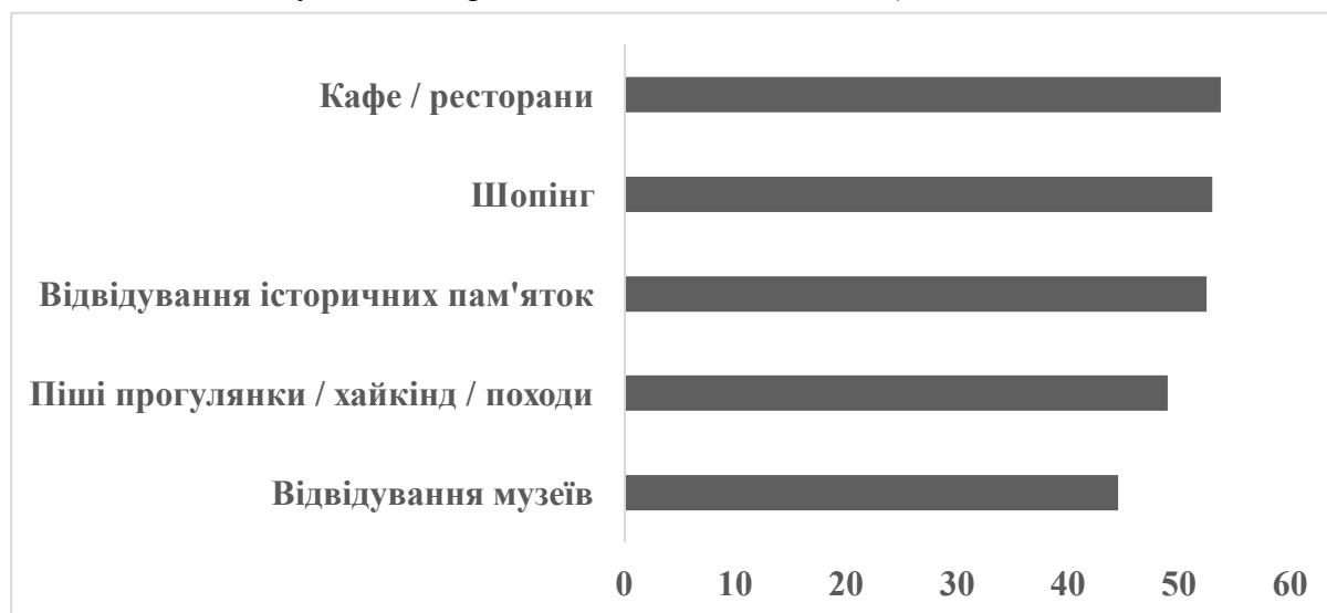
Рис. 3. Особливості молодіжної туристичної індустрії