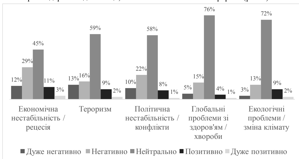
Рис. 2. Фактори, які впливають на розвиток туристичного бізнесу Джерело: [10].

Якщо проаналізувати фактори, які впливають на розвиток туристичного бізнесу у сфері молодіжного туризму, то найбільш вагомим позитивним чинником буде показник охорони здоров'я в дестинації, а найбільш негативним – тероризм (рис. 2).