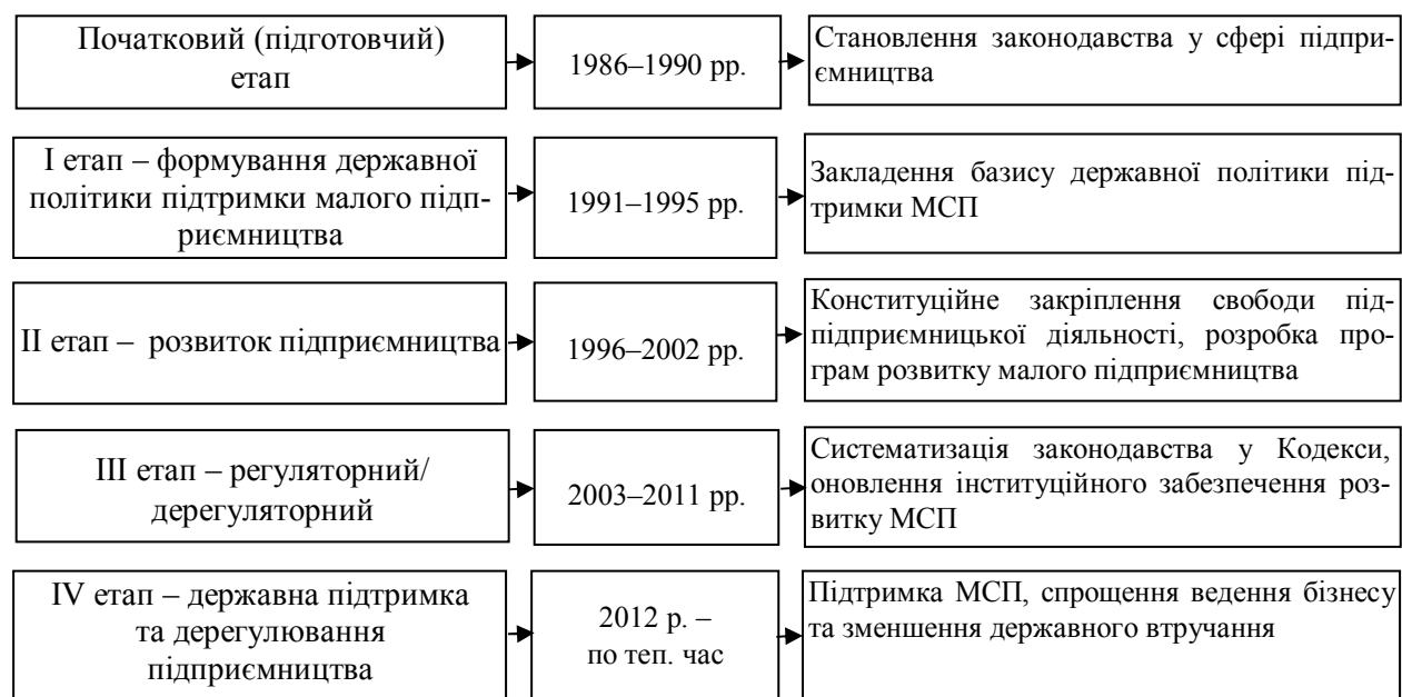
Рис. 1. Періодизація розвитку законодавчого забезпечення підприємництва в Україні

Виклад основного матеріалу. Періодизацію розвитку законодавчого забезпечення підприємництва в Україні представлено на рис. 1.