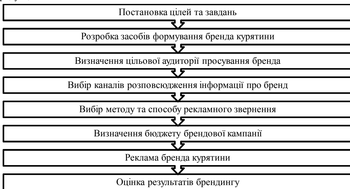
Рис. 1. Етапи розроблення бренда курятини

На першому етапі потрібно визначити цілі та завдання у сфері комунікації та збуту продукції.