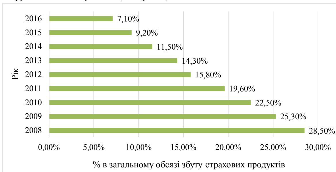
Рис. 3. Динаміка банкострахування в Україні протягом 2008–2016 років

Протягом 2008-2016 рр. в Україні у відносинах між певною кількістю банківських установ і страхових компаній у контексті банкострахування спостерігаємо стагнацію. Максимальне значення банкострахування в загальному обсязі збуту страхових продуктів в Україні сягнуло 28,5 % у 2008 році [2], у 2013 р. – 14,3 % [2] і протягом 2008–2016рр. знизилася в 4 рази до 7,1 % (рис. 3).