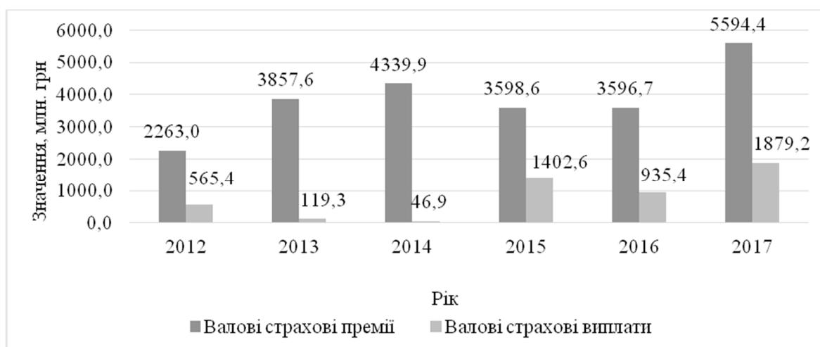
Рис. 2. Динаміка валових чистих страхових премій та виплат при страхуванні кредитів за 2012–2017 роки