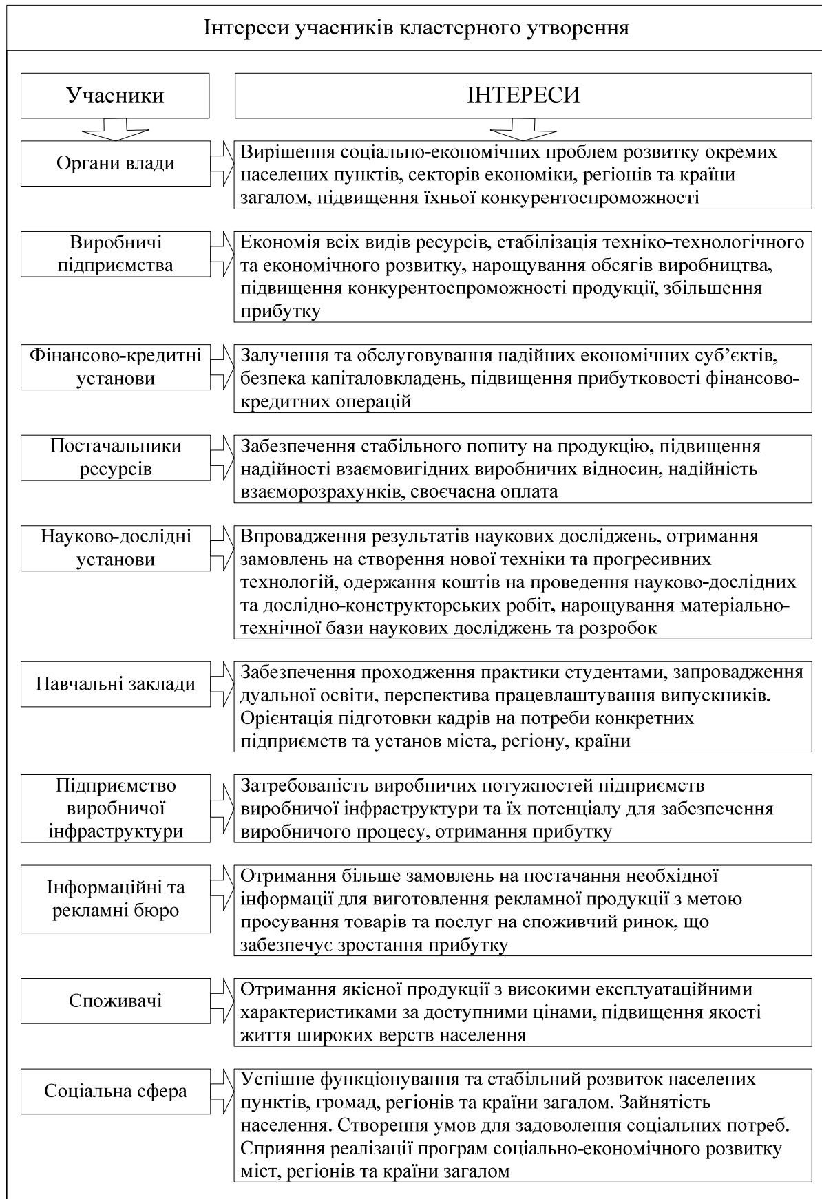
Рис. 2. Інтереси учасників кластерного утворення