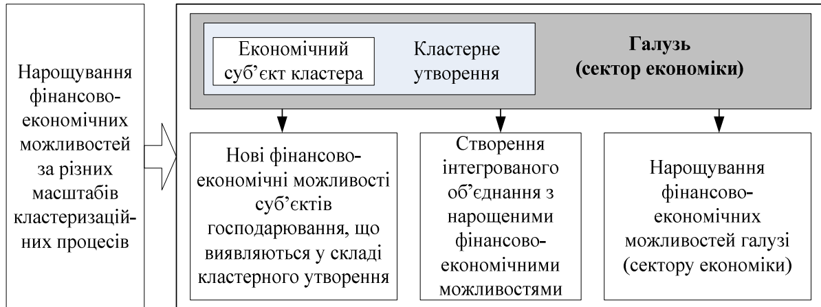
Рис. 3. Мотивація процесу кластеризації на різних ієрархічних рівнях економічних систем

Кількісні характеристики процесу кластеризації можна визначити за такими показниками: