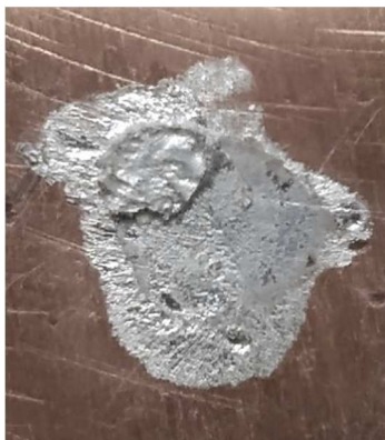
Рис. 3. Топографія поверхні зламу після випробувань на зріз ( \times 8 )

Міцність зварного з'єднання становить 80-82 % від міцності основного матеріалу (алюмінію АД0). При цьому встановлено, що величина залишкової деформації не перевищує 2 % від початкової товщини деталі. Подальші дослідження в цьому напрямі продовжуються.