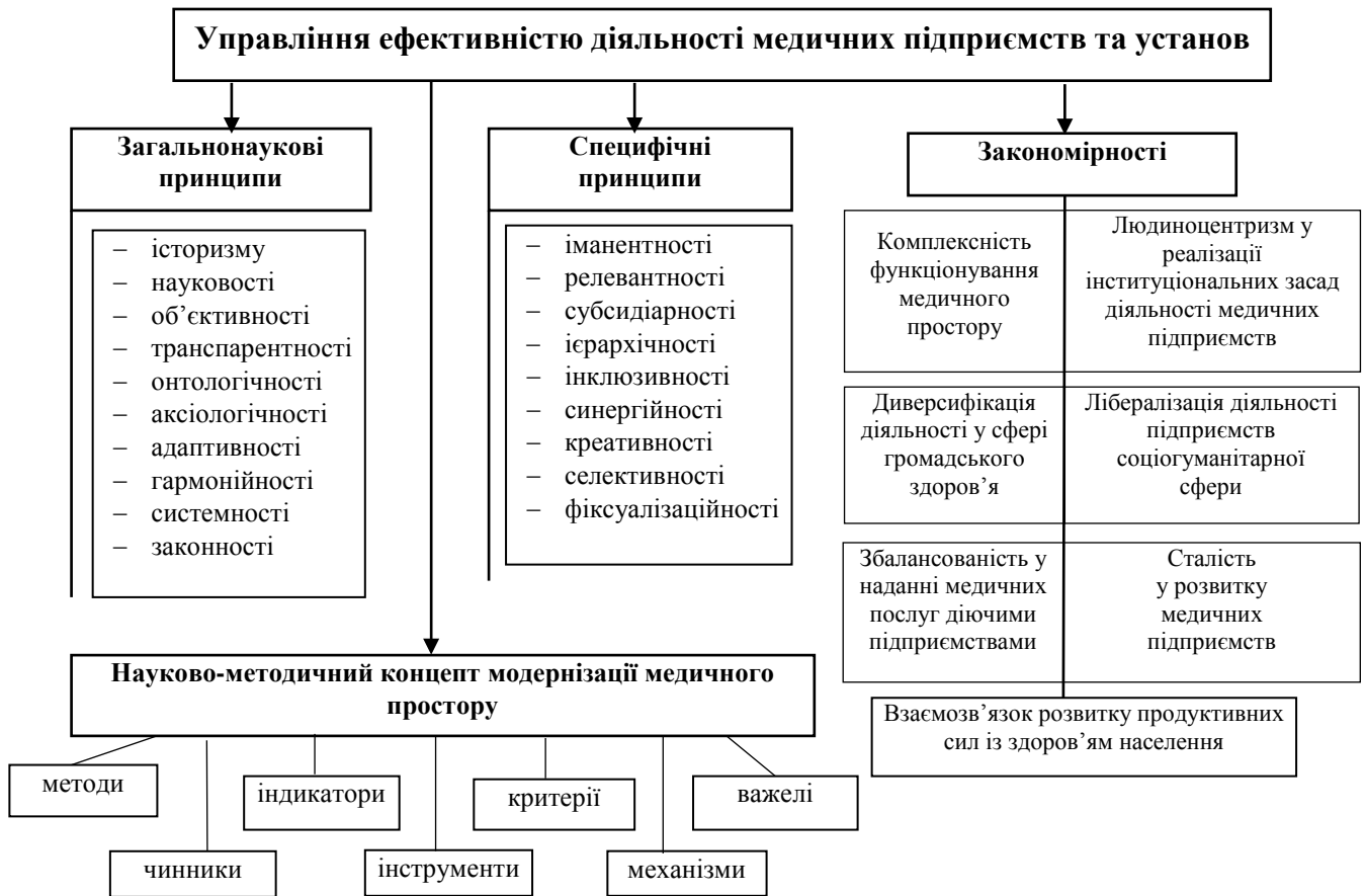
Рис. 1. Система принципів, закономірностей та методів управління ефективністю діяльності медичних підприємств та установ

У межах дисертаційного дослідження проведено критичний аналіз існуючих систем вимірювання ефективності та сформульовані основні принципи, закономірності та науково-методичний концепт, якими повинна володіти дієва система вимірювання ефективності (рис. 1).