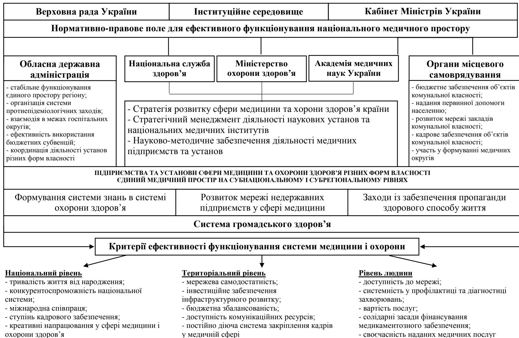
Рис. 4. Управлінська модель функціонування підприємств та установ медицини й охорони здоров'я в модернізаційних умовах