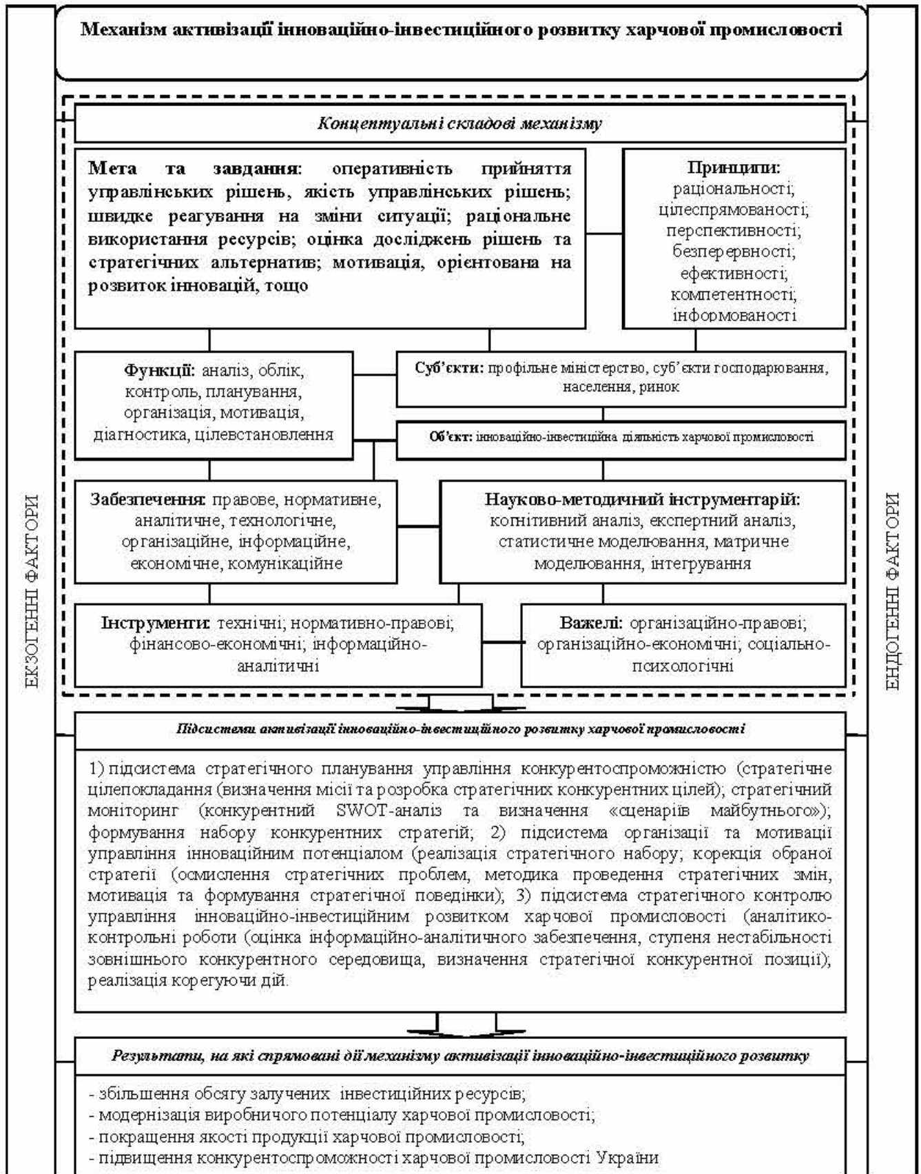
Рис.2. Теоретична конструкція механізму активізації інноваційно-інвестиційного розвитку харчової промисловості