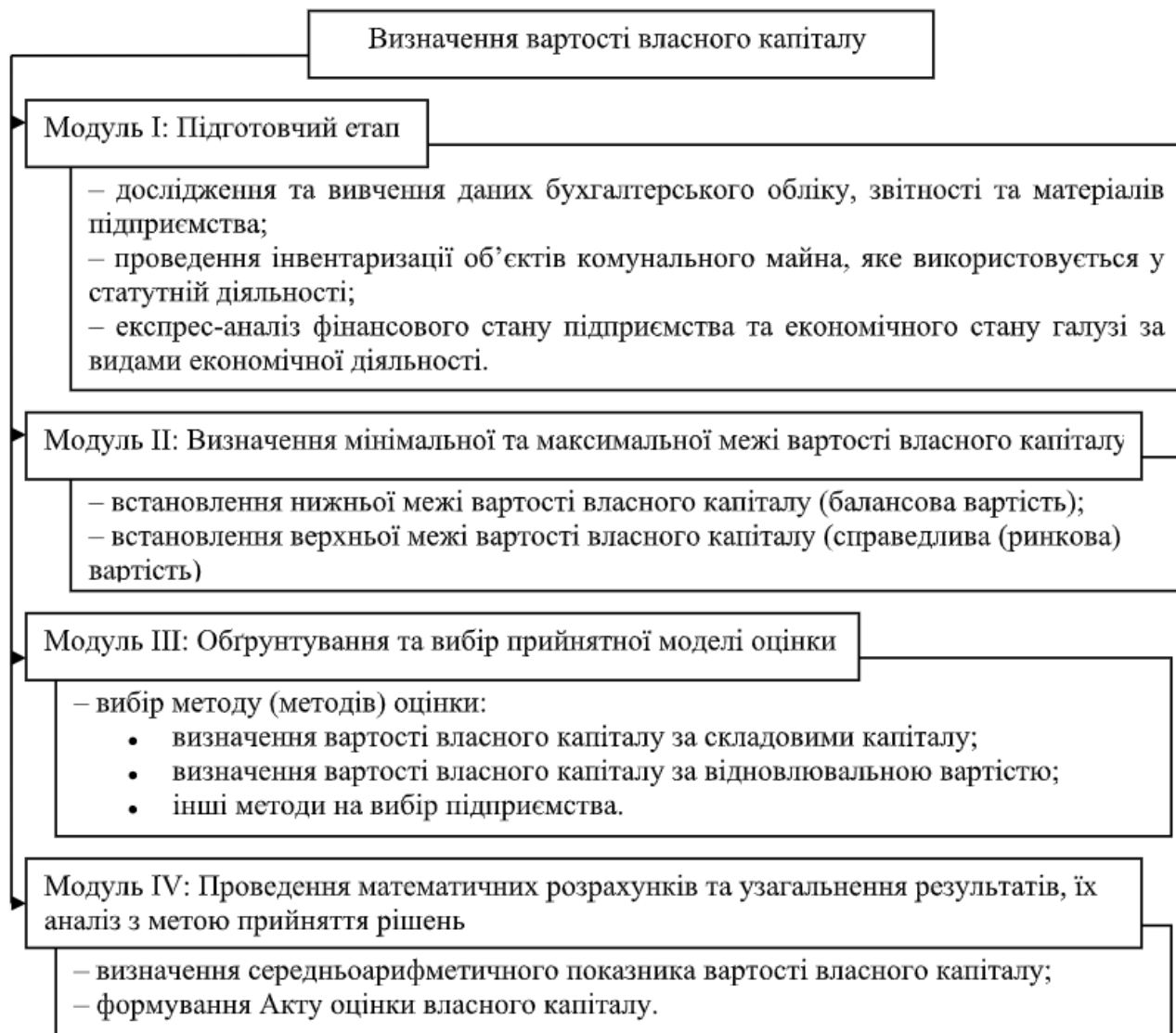
Рис. 2. Модульна схема визначення вартості власного капіталу на КП «Чернігівводоканал»

Застосування фізичної концепції КП «Чернігівводоканал» забезпечить можливість відтворення вкладеного капіталу і сприятиме підтриманню виробничих потужностей підприємства.