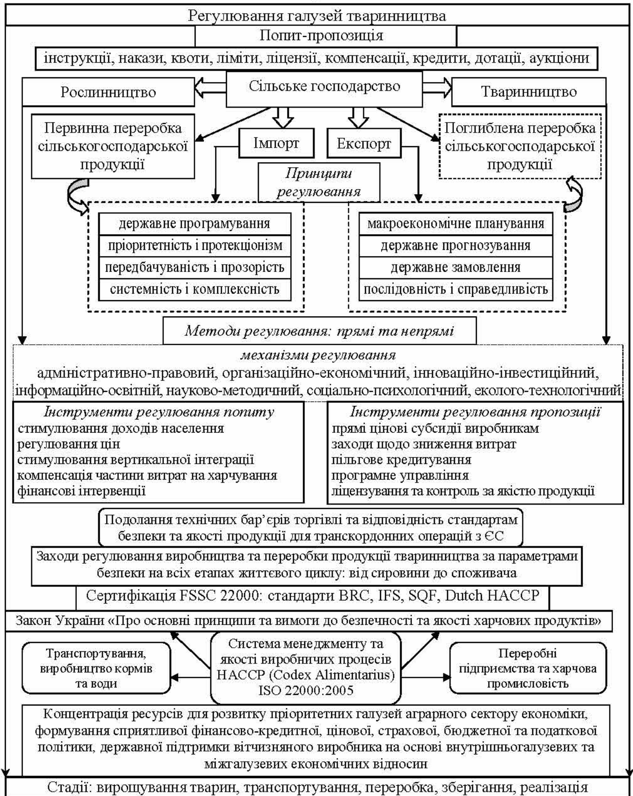
Рис. 1. Інструментарій регулювання розвитку галузей тваринництва в контексті Угоди про асоціацію між Україною та Європейським Союзом

На основі аналізу вітчизняного та закордонного досвіду розкрито трактування поняття «державне регулювання», а в дисертації запропоноване авторське тлумачення поняття «державне регулювання козівництва», що формує єдину, узгоджену світовою практикою, систему категоріального апарату, дає