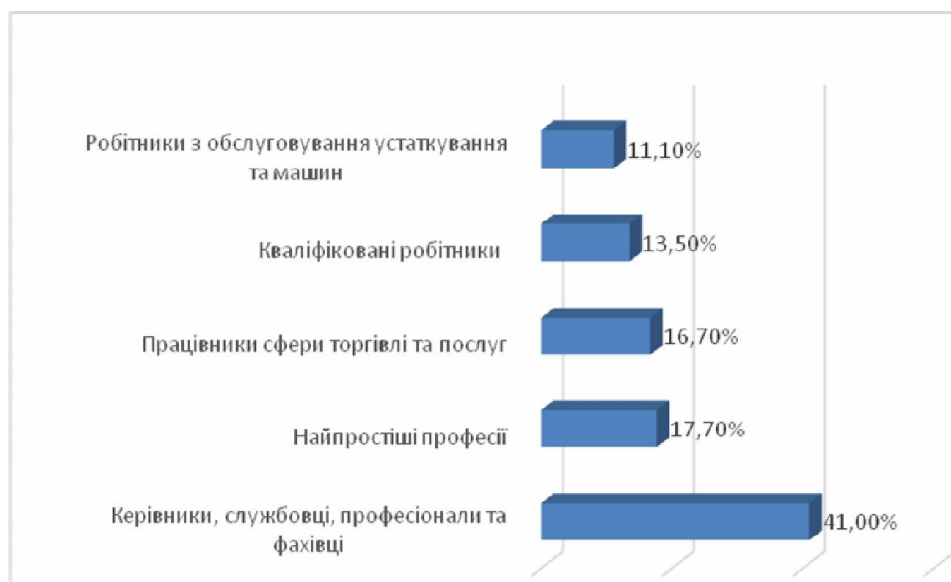
Рис. 1.1. Структура зайнятого населення за професійними групами у 2019 р. на ринку праці в Україні (за даними наведеними на офіційному сайті Державної служби зайнятості України) [22]

За професійними групами у 2019 р. 41% зайнятих становили керівники, службовці, професіонали та фахівці, 18% – особи, що займали робочі місця, які належать до класу найпростіших професій, 17% – працівники сфери торгівлі та послуг, 14% – кваліфіковані робітники з інструментом та сільського господарства, 11% – робітники з обслуговування та машин (див. рис. 1.1.)