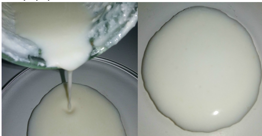
Рис. 1. Зовнішній вигляд кисломолочного продукту, приготованого шляхом внесенням 3 % житньої закваски

Для заквашування використовували не висушену виведену житню закваску. Закваску вносили в кількості 1; 2; 3 та 5 % до маси молока, що заквашували. За структурно-механічними властивостями згустку та за органолептичними характеристиками готового продукту (табл. 1, рис. 1, 2) визначили, що найкращі показники має продукт, отриманий при внесенні у молоко 3 % виведеної житньої закваски. Фізико-хімічні характеристики отриманого продукту наведені в табл. 2.