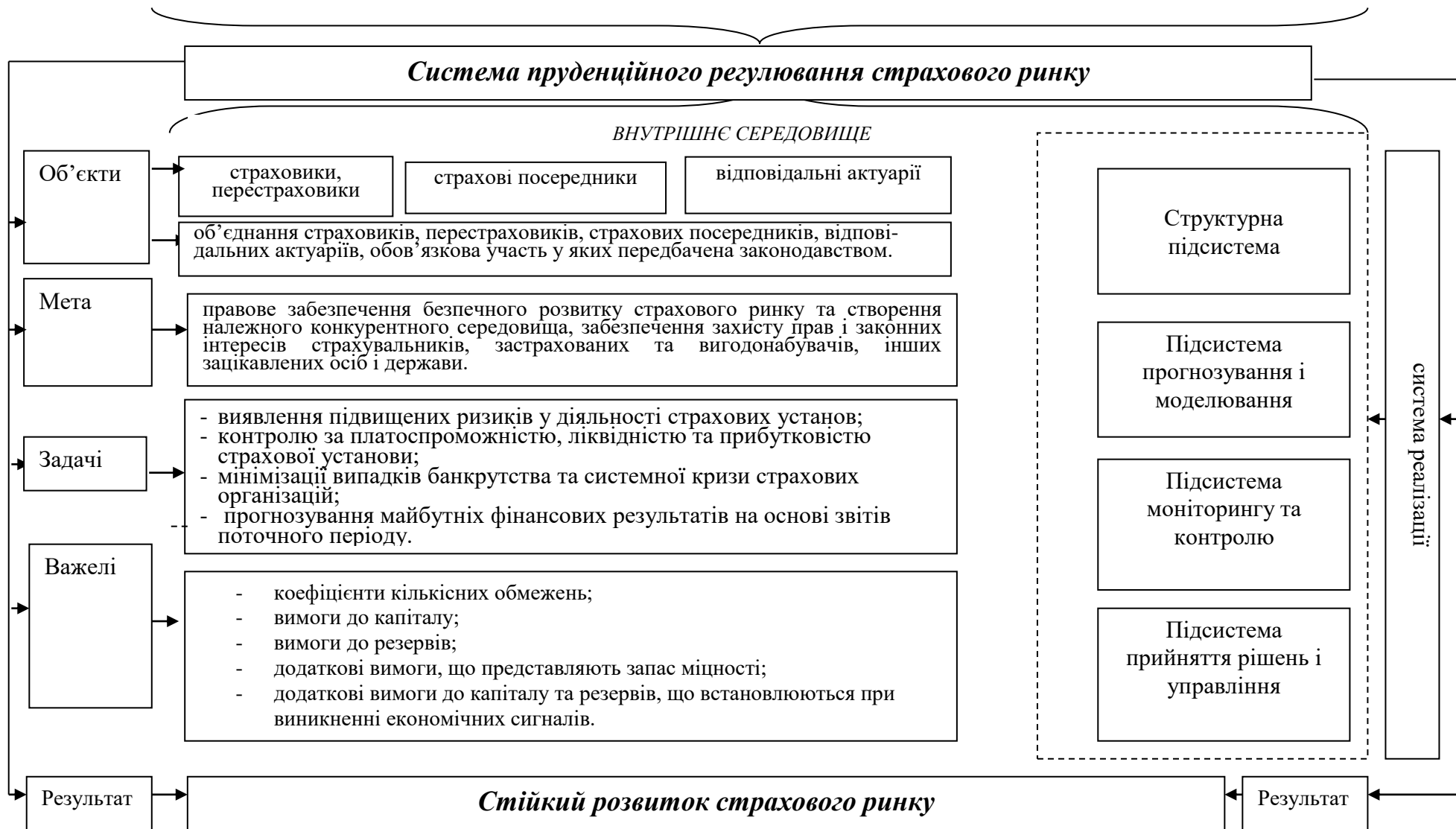
Рис 1. Теоретичні контури пруденційного регулювання розвитку страхового ринку [побудовано авторкою]