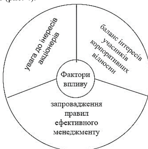
Рис. 4. Фактори підвищення конкурентоспроможності за допомогою корпоративного управління

Роль корпоративного управління полягає у його значному впливі на підвищення конкурентоспроможності та прибутковості завдяки забезпеченню органічному поєднанні ключових факторів (рис. 4).