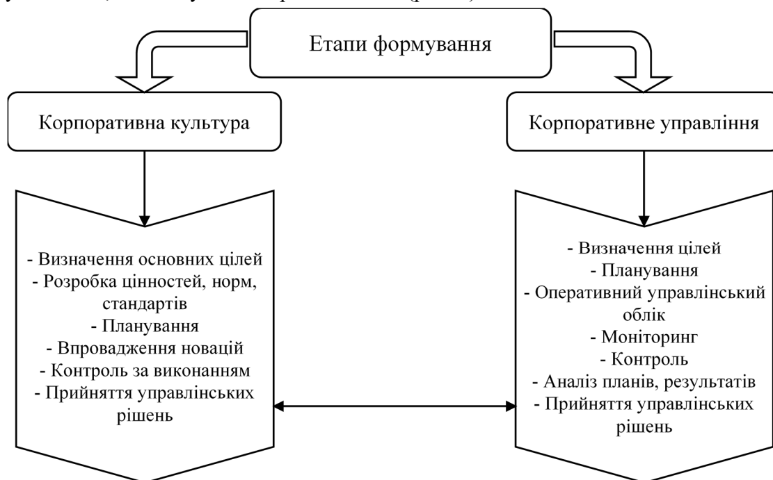
Рис. 3. Етапи формування корпоративної культури та корпоративного управління

Для визначення аспектів взаємодії зазначених понять спочатку потрібно охарактеризувати етап, на якому вони перетинаються (рис. 3).