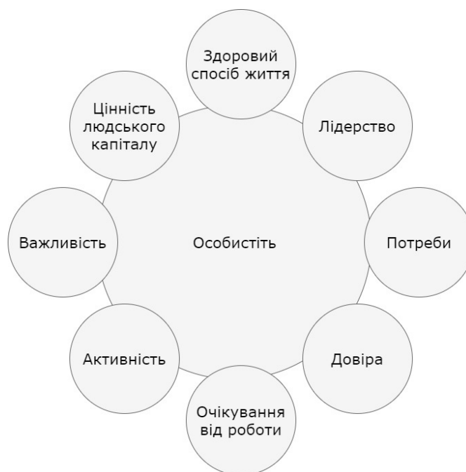
Рис. 1. Основа вивчення корпоративної культури