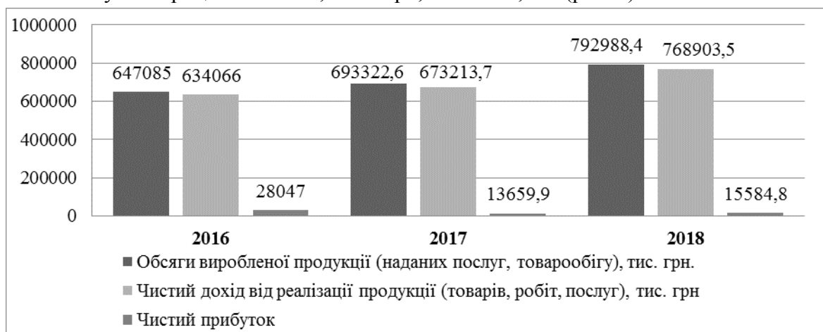
Рис. 3. Динаміка зміни основних показників фінансово-господарської діяльності комунальних підприємств Чернігівської області за 2016–2018 роки

За підсумками фінансово-господарської діяльності комунальних підприємств Чернігівської області за 2018 рік обсяги виробленої продукції (наданих послуг, товарообігу) становили 792 988,4 тис. грн, що більше за результат 2017 року на 99 665,8 тис. грн, або на 14,4 %, та більше за результат 2016 року на 145 903,4 тис. грн, або на 22,5 %. Найбільшу питому вагу в загальних обсягах доходів за останні 3 роки займали КП «Ліки України» (66-68 %) та КП «Чернігівоблагроліс» з дочірніми підприємствами (28-30 %). Загальна сума чистого доходу від реалізації продукції (товарів, робіт, послуг) по всіх комунальних підприємствах за 2018 рік становила 768 903,5 тис. грн, що більше ніж у 2017 році на 96 335 тис. грн, або на 14,3 %, та більше ніж у 2016 році на 134 837,5 тис. грн, або на 21,3 % (рис. 3).