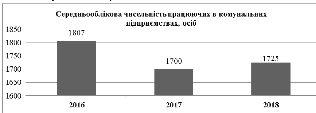
Рис. 2. Динаміка зміни середньооблікової чисельності працюючих на комунальних підприємствах в еквіваленті повної зайнятості за 2016–2018 рр.

Говорячи про середньооблікову чисельність працюючих на комунальних підприємствах регіону, слід зазначити, що у 2017 відбулося її суттєве зменшення (на 107 осіб), причиною якого є те, що 5 підприємств, які у 2016 році перебували у стадії припинення діяльності, були остаточно ліквідовані (рис. 2). Однак уже у 2018 році спостерігається зростання цього показника на 25 осіб. Цього вдалося досягти завдяки стабільній діяльності вже діючих та створенням двох нових комунальних підприємств.