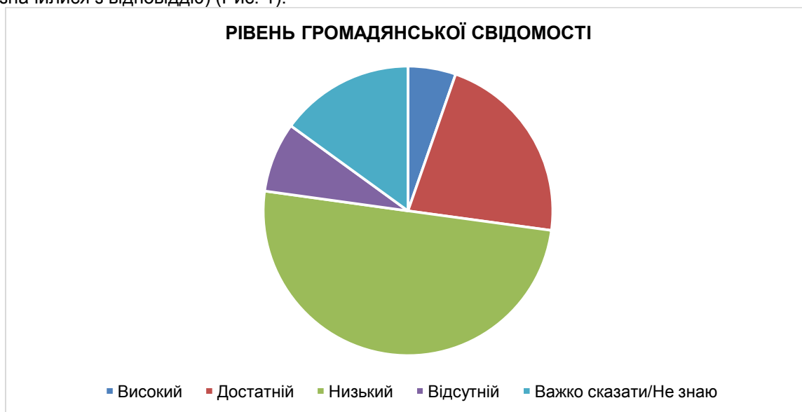
Рис. 1 Електоральна оцінка рівня громадянської свідомості

приблизно 58% опитаних назвали його низьким або відсутнім, близько 28% вважають його достатнім або високим (останній показник послаблюється на тлі 15% тих респондентів, які не визначилися з відповіддю) (Рис. 1).