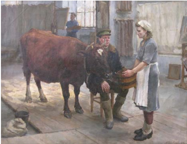
2. Корова. Академічна постановка. 1949 р., полотно, олія, 69×89.