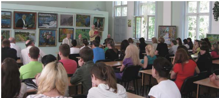
Фото зустрічі з художником у ЧДІЕУ