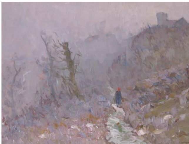
6. Туман. 1965 р., картон, олія, 60,5×80.