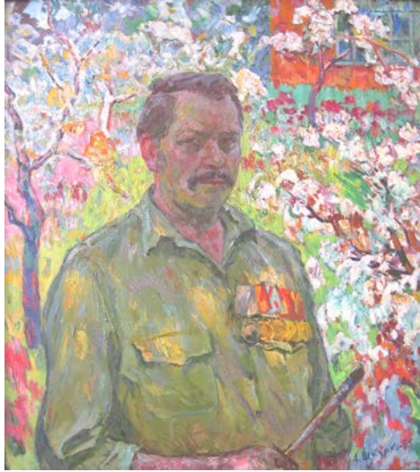
1. Автопортрет. 1985 р., полотно, олія, 91×80,5.