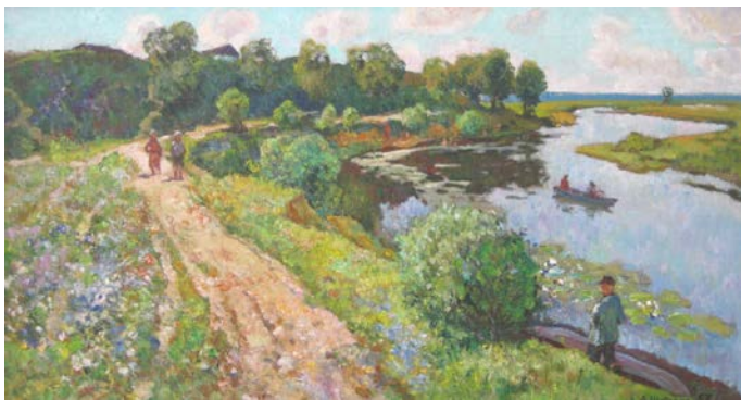
3. Літо на Качанівському хуторі (с. Надинівка). 1957 р., картон, олія, 54×100.