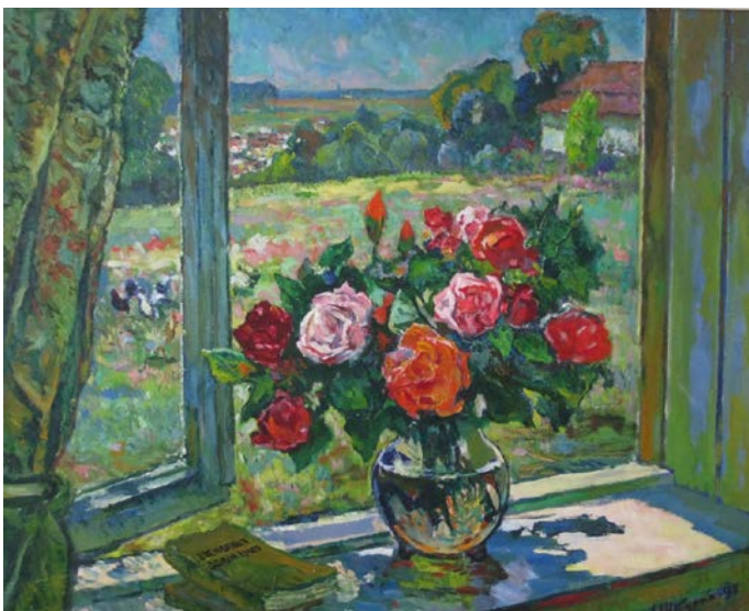
10. Вікно з трояндами. 1990 р., картон, олія, 79,5×100.