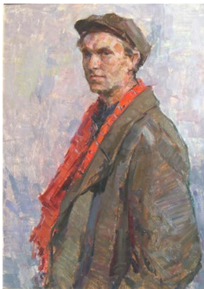
4. Заслужений художник України А. Мордовець. 1958 р., картон, олія, 69×49,5.