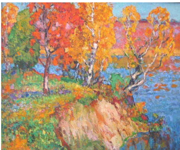
13. Осінь на р. Снов (с. Макишин). 1996 р., полотно, олія, 70×85.