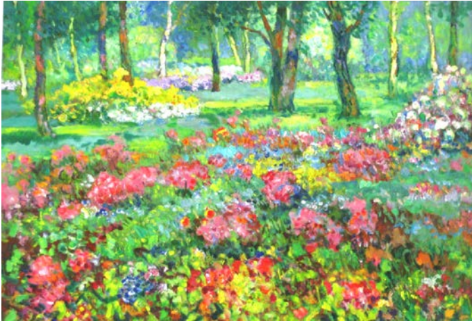
15. Літо у міському парку. 2007 р., картон, олія, 70×100.