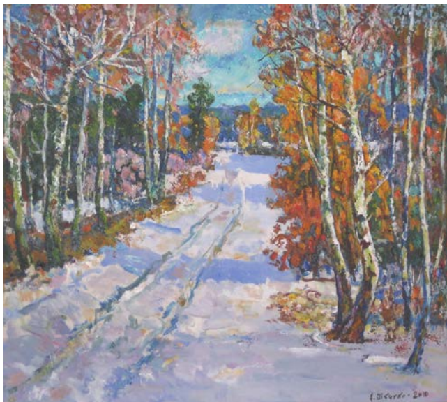
19. Березневе сонце. 2010 р., картон, олія, 101×104.