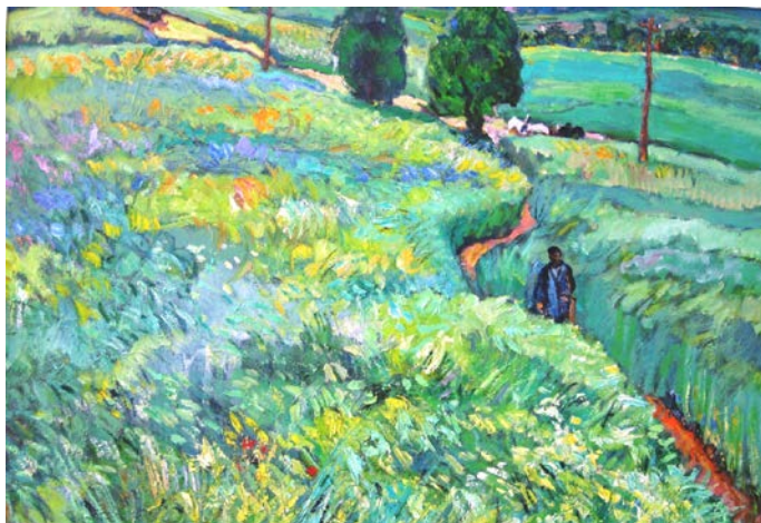
5. Жито наливається. 1962 р., картон, олія, 70×100.