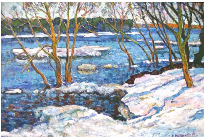
9. Весна в Седневі. 1978 р., картон, олія, 70×100.