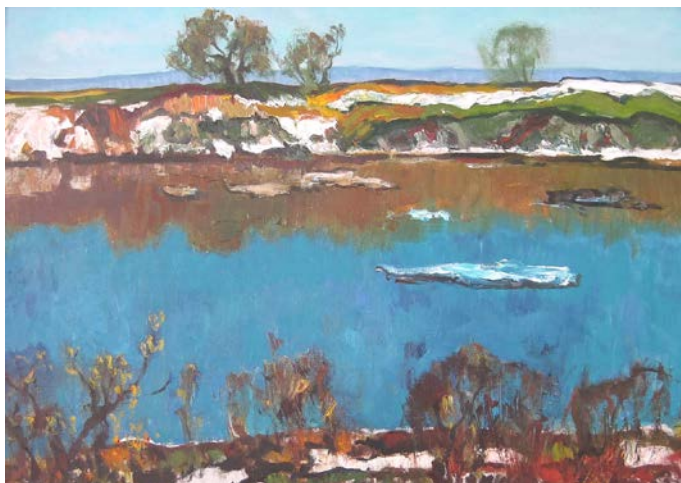
14. Провесінь. 2004 р., полотно, олія, 70×100.