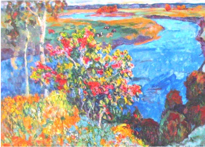
11. Вечір. 1993 р., картон, олія, 70×100.