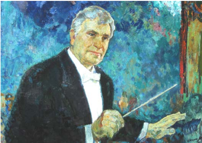
16. Портрет диригента М. Сукача (етюд). 2009 р., картон, олія, 70×100.