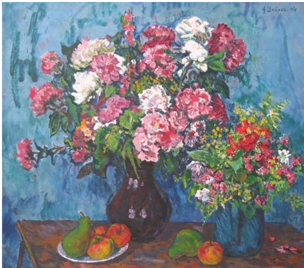
12. Квіти і фрукти. 1994 р., оргаліт, олія, 78,5×90,5.