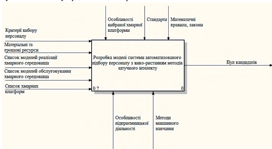
Рис. 1. Контекстна діаграма системи автоматизованого підбору персоналу

Загальна модель системи автоматизованого добору персоналу з використанням методів штучного інтелекту представлена на рис. 1-2.