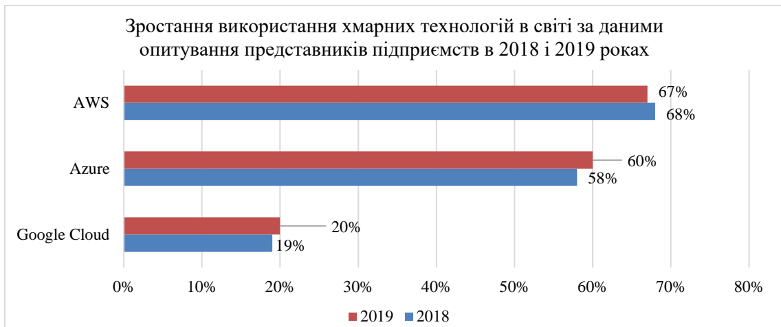
Рис. 4. Зростання використання хмарних технологій в світі за даними опитування представників підприємств в 2018 і 2019 роках Джерело: [10, с. 34].

На третьому етапі результати другого етапу будуть виведені в зручному для рекрутера вигляді.