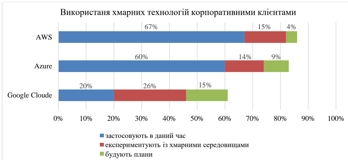
Рис. 3. Використання хмарних технологій корпоративними клієнтами Джерело: [10, с. 34].