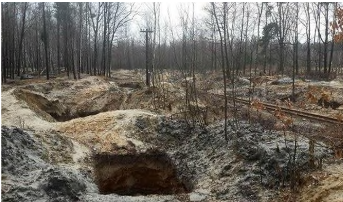
Рис. 3. Порушені землі в наслідок незаконного видобутку бурштину

Кар'єри, які утворюються внаслідок помпового методу видобутку, – це постійне джерело та осередок розповсюдження водної ерозії, що призводить до зниження родючості ґрунту, порушення дренажну підземних вод; зміни мікроклімату; загибелі деревної рослинності та знищення трав'яного покриву (рис. 3).