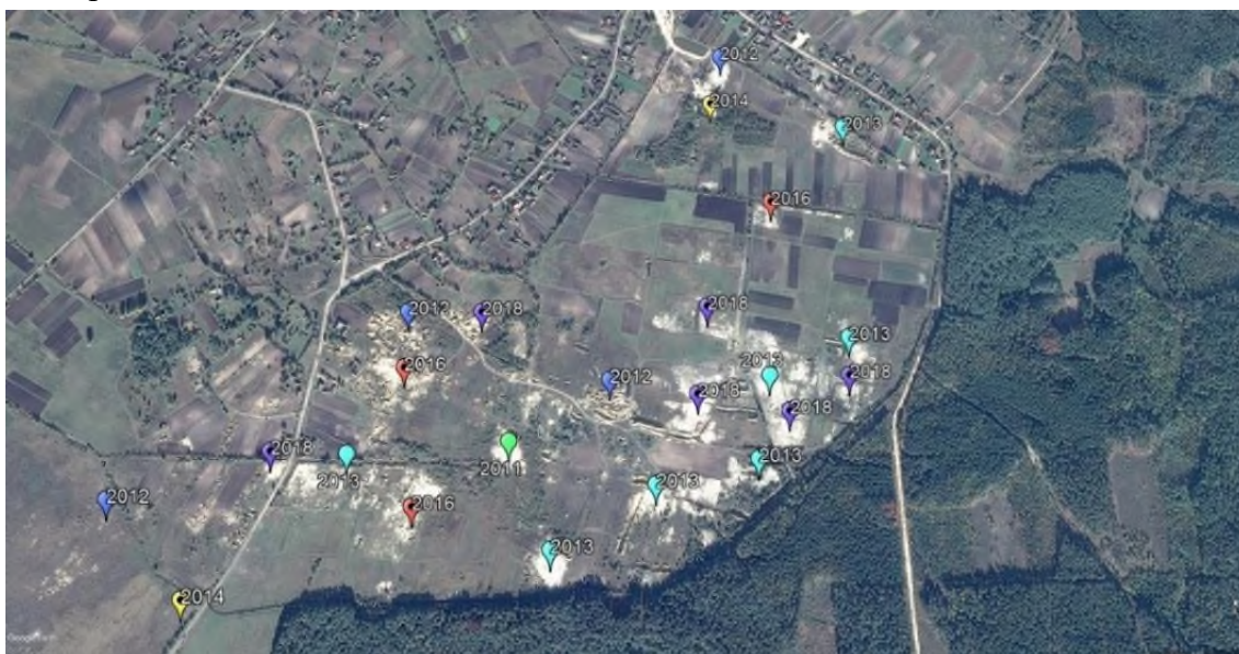
Рис. 1. Схема ідентифікації ділянок нелегального видобутку бурштину за роками з 2011–2019 рр. с. Дубівка Володимирецький район Рівненська область.

Об'єктом дослідження слугував масив на території Каноницької сільської ради поблизу с. Дубівка Володимирецького району Рівненської області (рис. 1). Відповідно до методики застосування матеріалів багатозональних космічних зйомок, яка дозволяє з великою достовірністю визначити й локалізувати місця незаконного видобутку та реально оцінити масштаби екологічного лиха [7], проаналізовано космічні знімки за період з 2011 по 2019 роки.