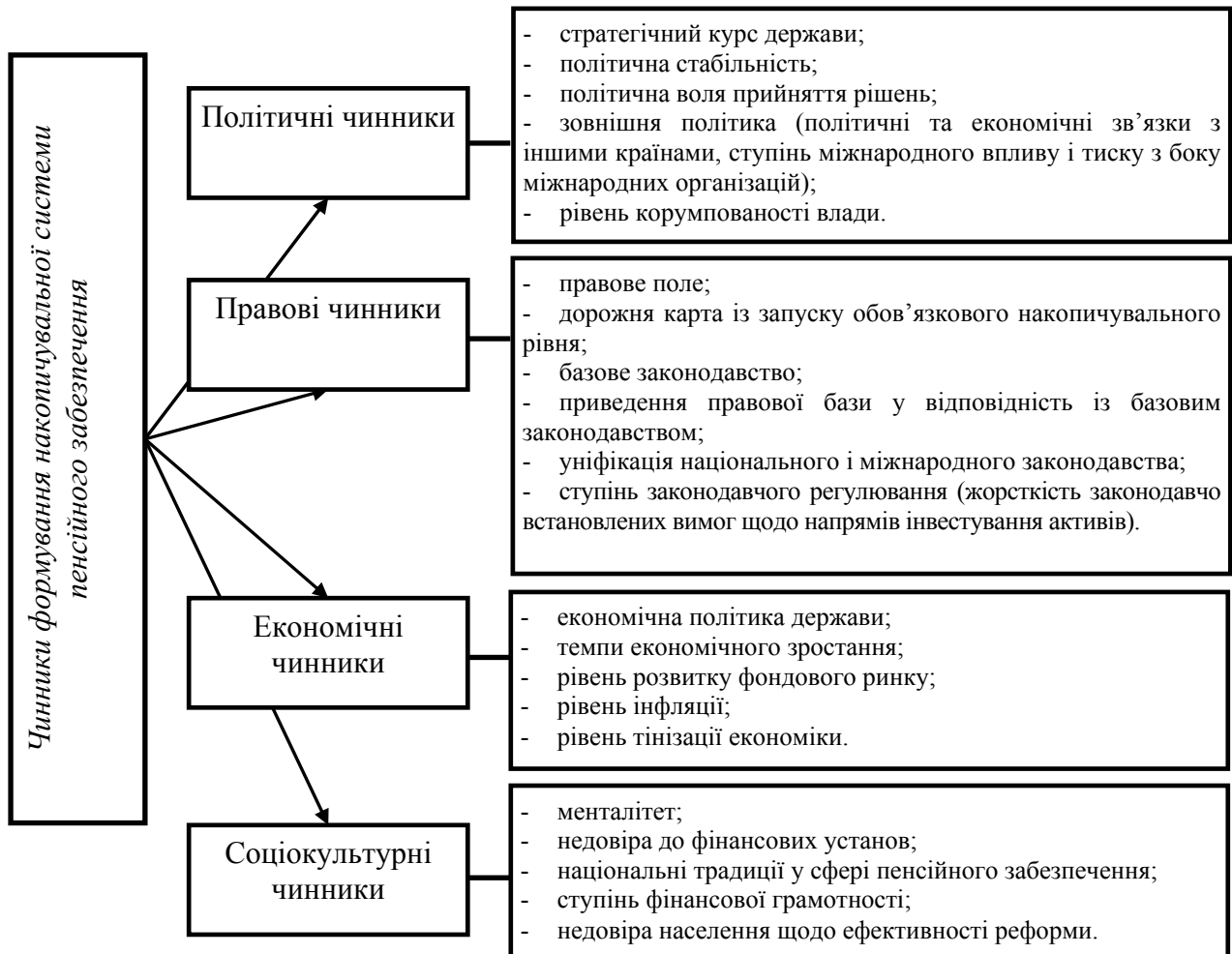
Рис 2. Ключові чинники формування накопичувальної системи пенсійного забезпечення

Систематизовано ключові чинники, що зумовлюють перспективи та динаміку розвитку системи накопичувального пенсійного забезпечення, а також окреслюють поле можливостей її трансформації задля примноження пенсійних доходів населення (рис. 2). Урахування вектору та наслідків впливу встановленого переліку чинників дозволить розробити дієвий комплекс заходів, спрямований на перехід до якісно нової пенсійної системи за рахунок максимально повного охоплення населення її накопичувальною складовою.