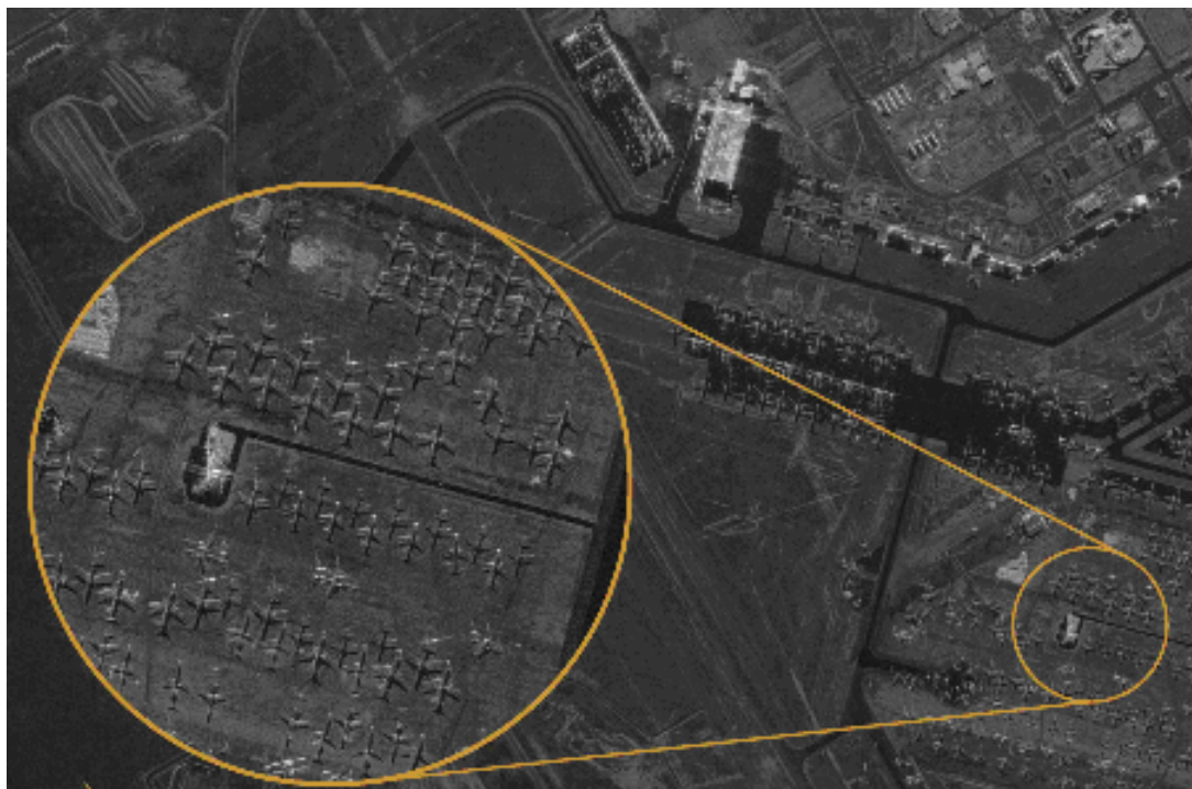
Рис. 5. Радіолокаційне зображення Центра авіації Розуела в Нью-Мексичі

На рис. 5 показано розташування літаків в Центрі авіації Розуела в Нью-Мексичі, яке отримано від супутника Capella-2. Видно літаки та їхні тіні, які розкривають такі незначні деталі, як розміри кабіни екіпажу, двигуни [15].