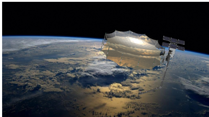
Рис. 4. Супутник з синтезованою апертурою Capella-2 на навколосемній орбіті

У 2020 році було виведено на навколосемну орбіту супутник із синтезованою апертурою радіолокаційного спостереження Capella-2 (рис. 4) [15].