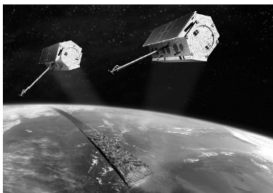
Рис. 3. Угрупування супутників ДЗЗ: TerraSAR-X і TanDEM-X

Відоме використання угруповання супутників дистанційного зондування Землі (ДЗЗ) (рис. 3).