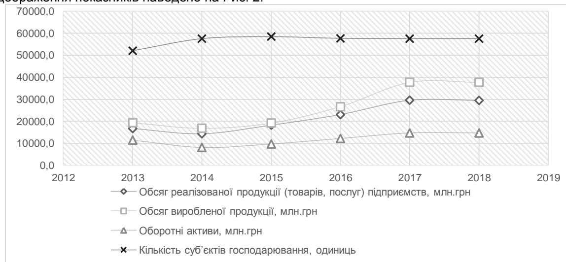
Рис. 2. Прогноз на 2018 рік обсягів реалізованої продукції (товарів, послуг) підприємств тимчасового розміщування та організації харчування за допомогою побудованої моделі

Таким чином можна зробити висновок про зменшення обсягу реалізації продукції (товарів, послуг) підприємств у 2018 році за умов збереження показників обсягу виробленої продукції, оборотних активів та кількості суб'єктів господарювання на рівні 2017 року. Графічне відображення показників наведено на Рис. 2.