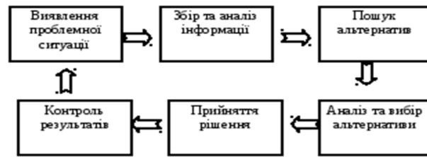
Рис. 2. Технологія раціонального прийняття рішень

Процес розробки та прийняття господарського рішення розпочинається з виявлення й формулювання сукупності проблем, які на даний момент виступають перед підприємством (підвищення прибутків, засвоєння нових видів продукції, розширення ринків збуту, зниження ефективності підприємства у порівнянні з попереднім періодом, невідповідність результатів запланованим цілям; незадовільні результати порівнянь з аналогічними підприємствами тощо)