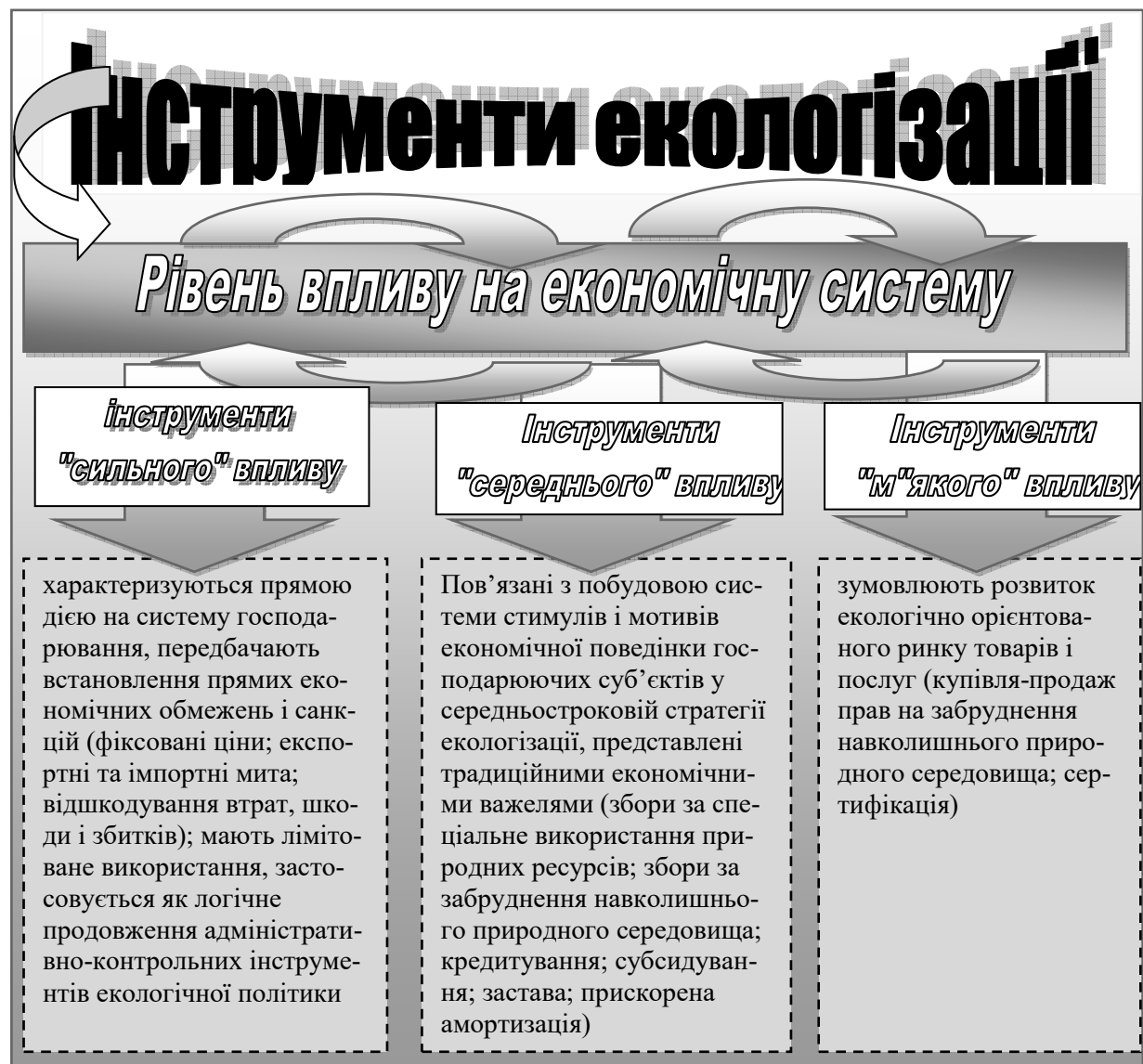
Рис. 2. Інструменти екологізації з урахуванням рівня їхнього впливу на економічну систему