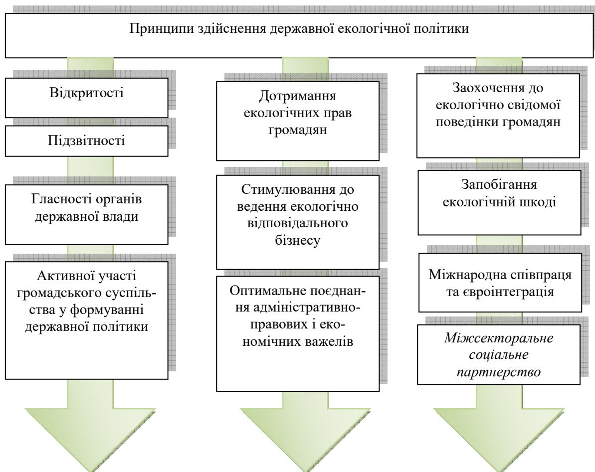
Рис. 3. Принципи здійснення державної екологічної політики

Системний підхід у реалізації державної екологічної політики зумовлює використання таких принципів: відкритості; гласності органів державної влади; підзвітності; активної участі громадського суспільства у формуванні державної політики; дотримання екологічних прав громадян; стимулювання до ведення екологічно відповідального бізнесу; заохочення до екологічно свідомої поведінки громадян; запобігання екологічній шкоді; міжнародна співпраця та євроінтеграція [9] (рис. 3).