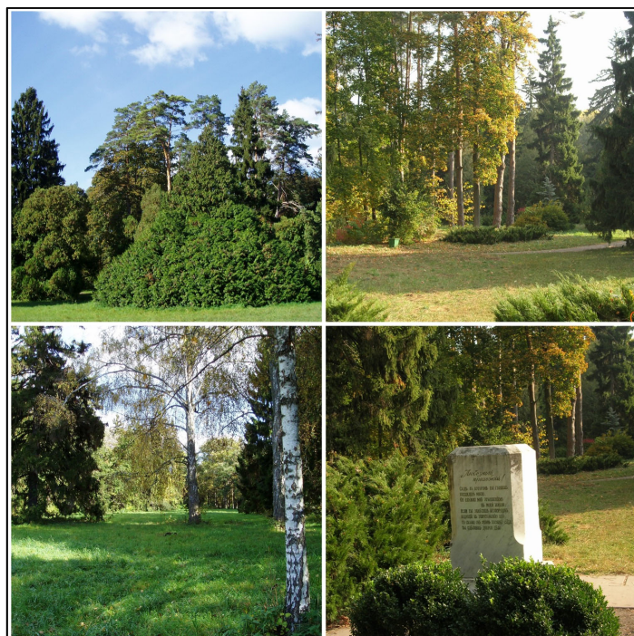
Рисунок 3 – Пейзажні картини галявин парку

Підкреслимо, той факт, що естетична виразність парку визначається не будівлями, скульптурами, фонтанами або іншими традиційними архітектурно-художніми атрибутами, а унікальними деревами-пам'ятниками, полянами, що відіграють роль своєрідних залів і анфілад; різними формами рельєфу землі, які утворюють «амфітеатри», «піраміди» і інші об'ємно просторові побудови (рис. 3).