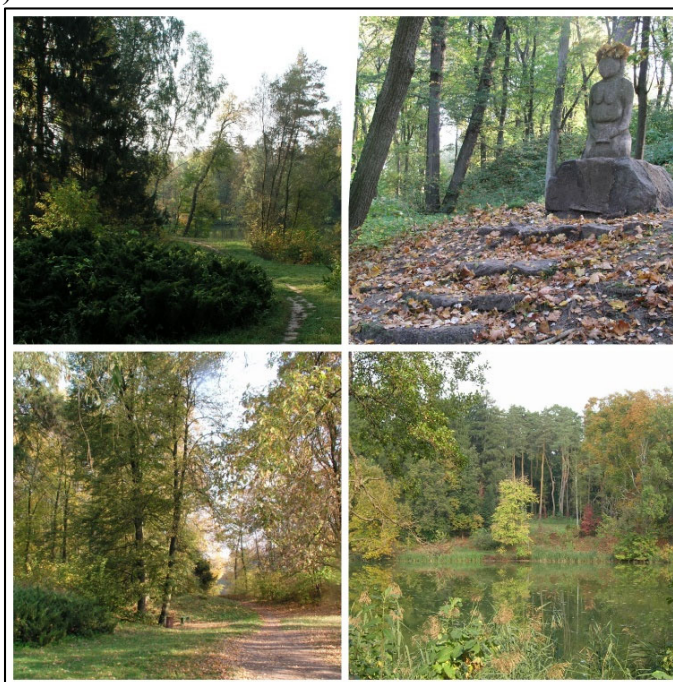
Рисунок 5 – Види деяких архітектурно-ландшафтних композицій дендропарку

Для приозерного району характерні різкі контрасти між відкритими світлими просторами Великого ставу і похмурими глибокими балками, які, розходячись від водойми, вриваються в масив лісу. Гірничо-горбистий район розташований в східній частині парку, тут перепади висот досягають свого максимуму (до 35 метрів). Ритмічна зміна ландшафтною картини («гори» – «ущелини» – «гори»), насадження різноманітних рослинних ансамблів по схилах і пагорбах, створює виключно мальовниче видовище, яке сприймається як створене природою (див. рис. 5).