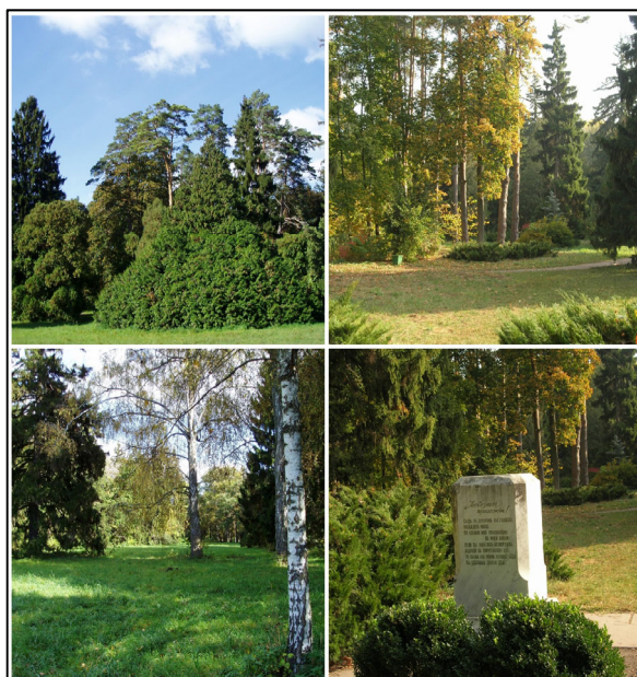
Рисунок 1 – Центральний вхід («екстер'єр») та типові «інтер'єри» парку

Досліджуючи композиційну побудову ландшафту можна помітити три цікаві і дещо специфічні особливості організації планувально-просторової структури Тростянецького парку. По-перше, це використання ефекту несподіванки . При підході або під'їзді до парку спостерігається поступове наближення зовнішніх «фасадів» парку, які не мають нічого спільного з тими картинами, які очікують відвідувачів в його «інтер'єрах» (рис. 1).