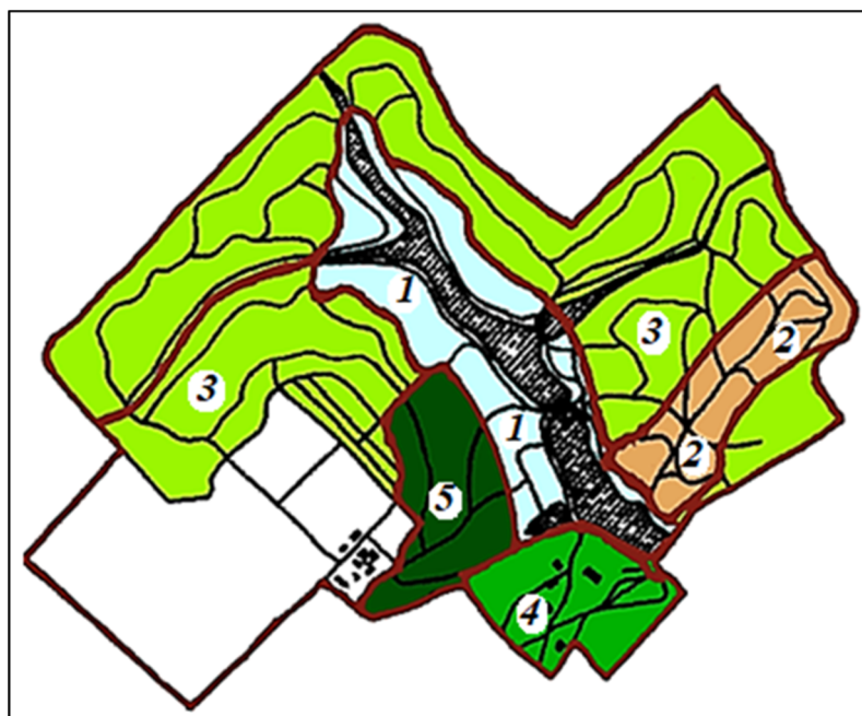
Рисунок 4 – Схема розташування пейзажних районів дендропарку

За структурою парк поділяється на декілька пейзажних районів (рис. 4), кожен з яких має специфічний характер організації ландшафтного простору: приозерний-балковий (1), гірничо-горбистий («Швейцарія») (2), рівнинний (3), присадибний (4) і лісовий (5).