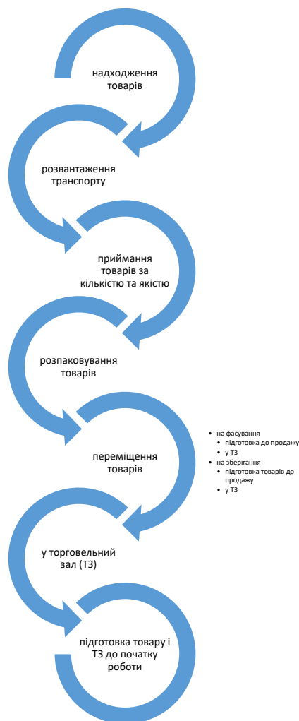
Рисунок 1 - Структура і послідовність операцій торговельно-технологічного процесу в магазинах

У звіті ЗВО повинні надати коротку характеристику операцій торговельно-технологічного процесу: приймання товарів, зберігання, розміщення у торговельному залі, реалізація кінцевому споживачеві, із зазначенням відповідальних осіб, документального оформлення, обладнання та інвентарю, які використовуються при здійсненні операції.