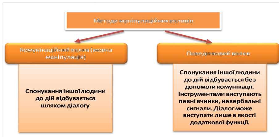
Рисунок 2 – Види методів маніпуляцій

Маніпуляція – це управління, але дещо нестандартне. Якщо розглядати питання з боку управління, то уявімо собі нараду з будь-якого питання в будь-якій компанії (табл.1).