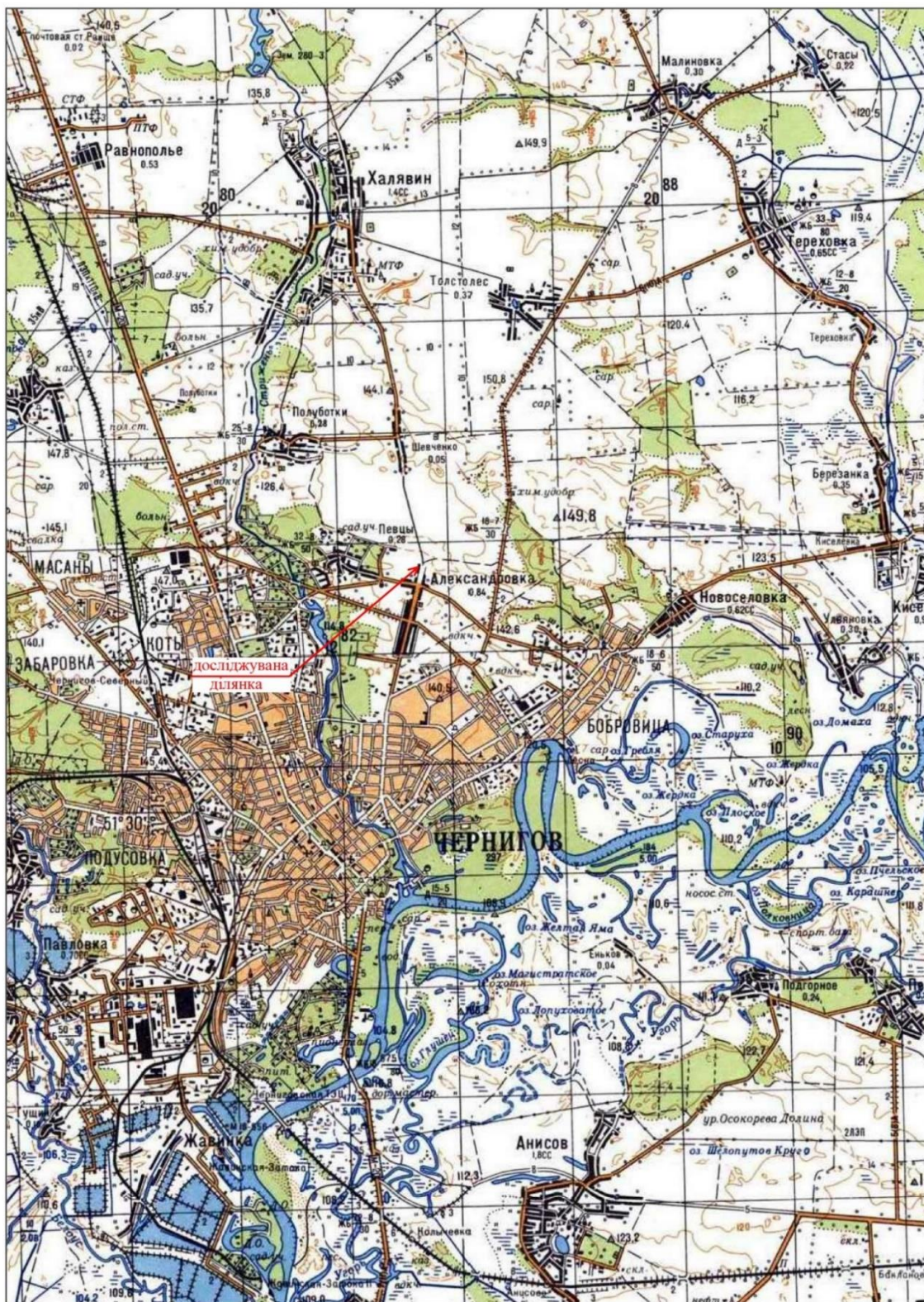
Рис. 1. Оглядова карта

Буріння свердловин здійснювалося механічним способом, а глибина та діаметр свердловин визначалися цільовим призначення їх. Після завершення робіт свердловини були ліквідовані відповідно до законодавства України.