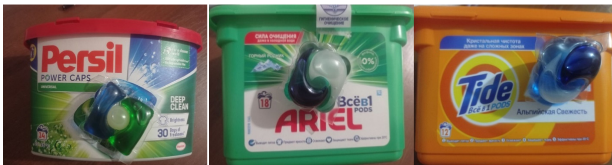
Рисунок 1 – Фото досліджуваних зразків

Об'єктом дослідження було обрано капсули для прання відомих торгових марок: Persil Універсал Duo, Ariel Pods Все-в-1 Гірське джерело, Tide Все в 1 Альпійська свіжість (рисунок 1). За класифікацією синтетичних мийних засобів обрані зразки є рідкими, універсальними та призначені для машинного прання. Дані засоби виділяються своєю зручністю та простотою у користуванні, не потребують додаткових вимірювань об'єму необхідного для прання та приладдя для набирання засобу.