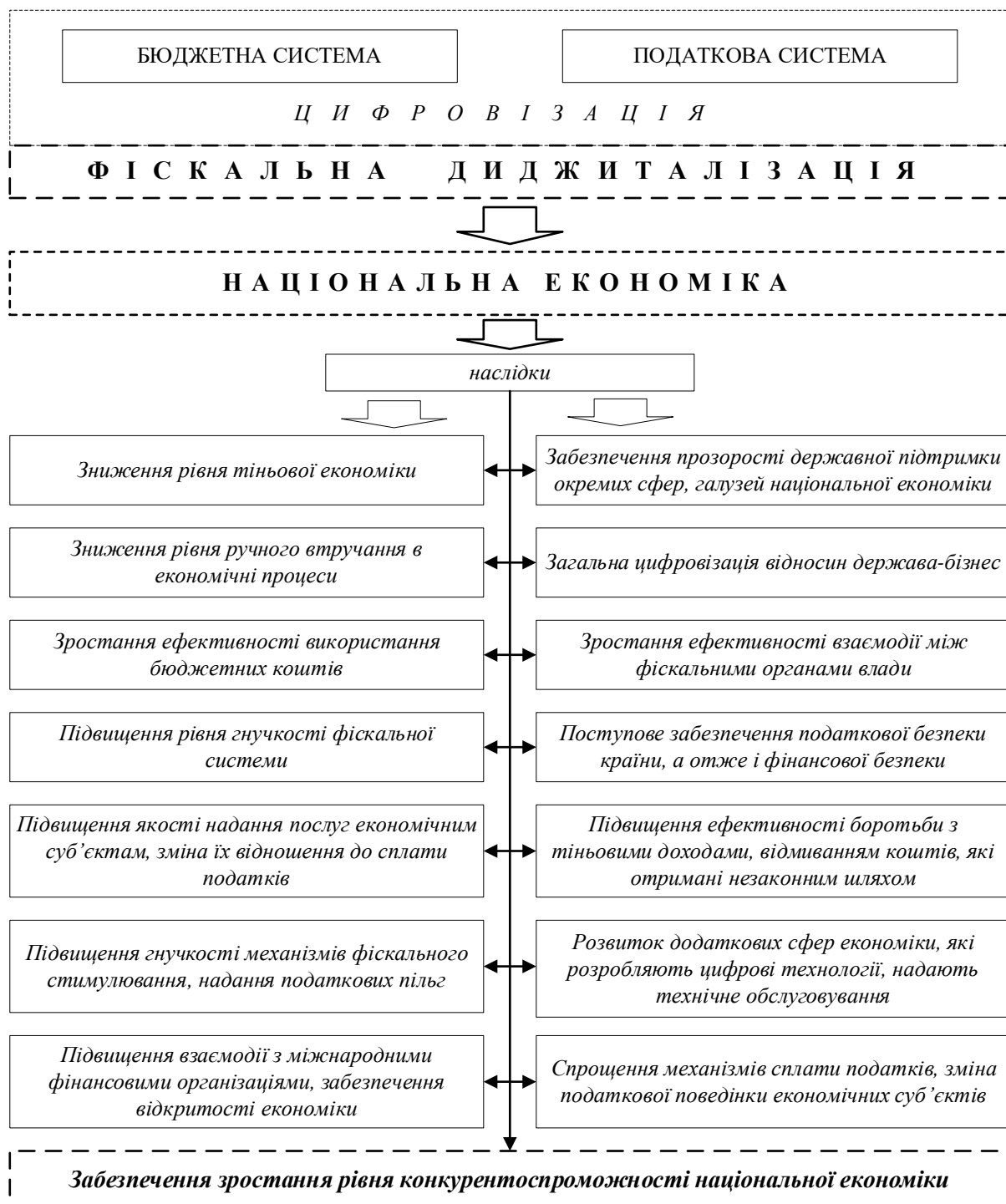
Рис. 2. Роль фіскальної диджиталізації в розвитку національної економіки Джерело: складено авторкою з урахуванням [1; 5; 10; 11].

Дані рис. 2 лише підтверджують важливість розвитку фіскальної диджиталізації в країні, її важливу роль у розвитку як фінансової системи, так і загалом національної економіки.