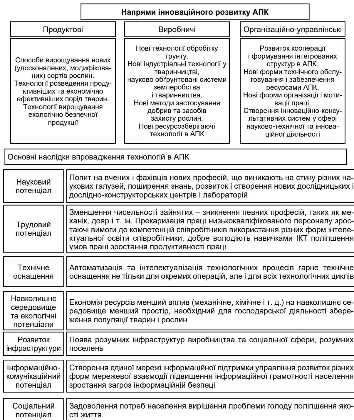
Рис. 2. Стратегія державної підтримки інноваційних технологій розвитку агропромислового комплексу в умовах інформаційної безпеки