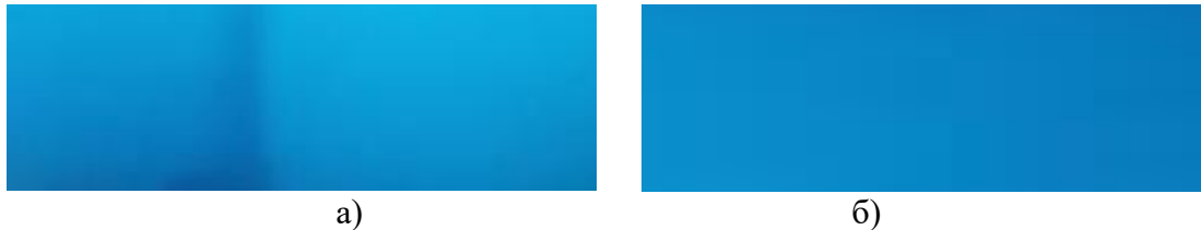
Рис. 2 – Фото труби виготовленої з ПВХ-композиції з додаванням стабілізатора а) Kimstab EPS 2100-22 FC та б) Ваеропан МС 91424 FP/1.

Але подальша додаткова термічна обробка для формування розтрубу супроводжується зміною кольору частини труби виготовленої композиції з додаванням стабілізатора Kimstab EPS 2100-22 FC (рис. 2 а). Це погіршує зовнішній вигляд виробу.