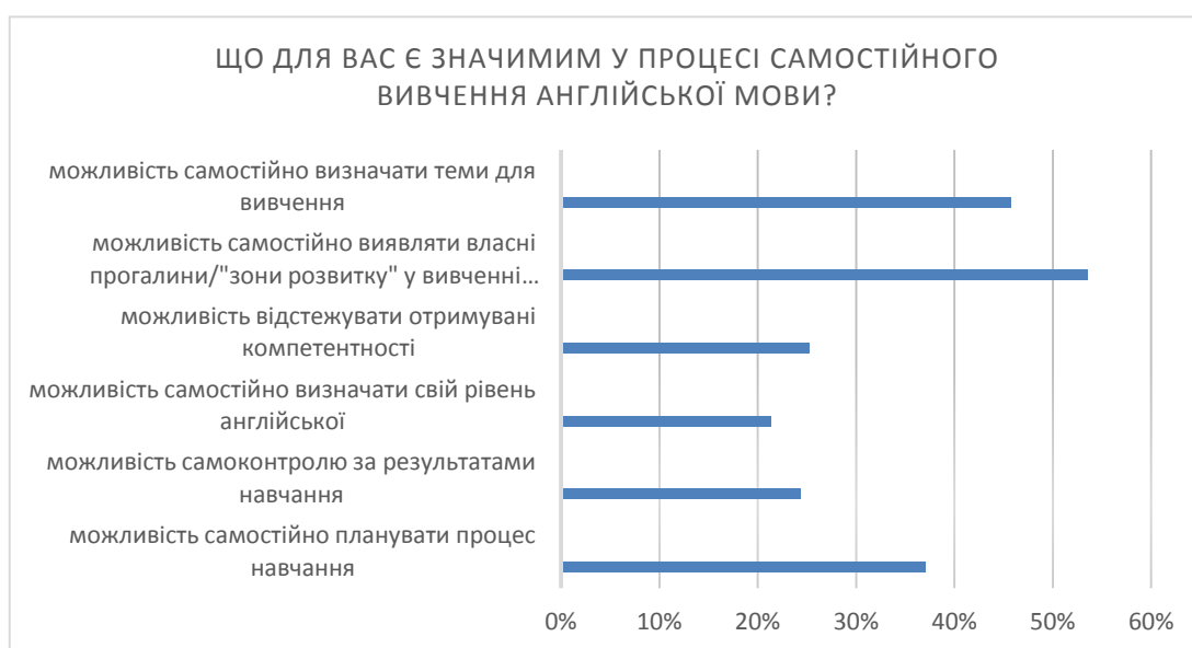
Рис. 1 Узагальнені результати опитування здобувачів щодо чинників, які є для них важливими під час самостійного опанування ІМ.

Найбільш значимим та цінним у процесі самостійного вивчення ІМ, серед наданих варіантів, здобувачі обрали можливість самостійно виявляти власні прогалини («зони розвитку») у вивченні ІМ, що, на нашу думку, є важливою передумовою для ефективної організації СР з підвищення власного рівня іншомовної компетентності. На другому місці, за результатами анкетування, знаходиться можливість самостійно визначати теми для вивчення, що наводить на думку про свідоме ставлення здобувачів до процесу вивчення ІМПС як інструменту для виконання майбутніх професійних та особистих завдань. І третє місце посіла можливість самостійно планувати процес вивчення ІМ, що може бути реалізована саме в рамках самостійного навчання. Досить високу підтримку отримали варіанти: «можливість самоконтролю за результатами вивчення англійської мови», «можливість відстежувати отримувані компетентності» та «можливість самостійно визначати свій рівень англійської мови» (див. Рис. 1).